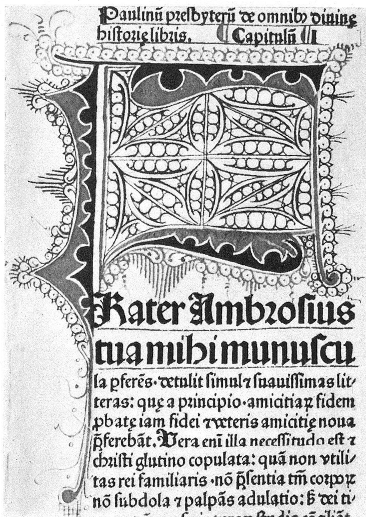
Abb. 3. Initiale F aus der lateinischen Bibel des Johann Amerbach, Basel 1479

Dorn aus der Pranke zieht. Eine rundbogige Türöffnung und ein hochrechteckiges Fenster gewähren den Blick in die freie Landschaft mit grünen Hügeln und Bäumen. Von der Initiale gehen Bordüren aus, welche die schmale Seiten- und die breitere Unterleiste mit Blumen und Blattranken in Blau, Rot, Grün und Oliv beleben, begleitet von den typischen kleinen Goldblattsonnen.