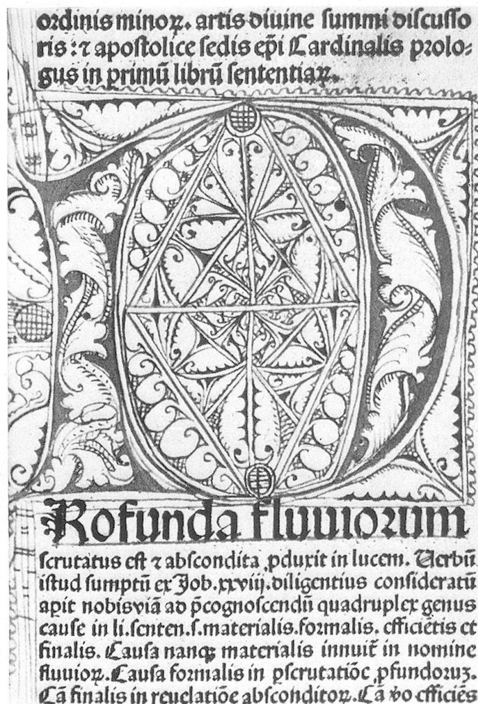
Abb. 4. Initiale P aus S. Bonaventuras Sentenzenbüchern, Koberger, 1491

ginalholzdeckelband mit gepreßtem Schweinsleder. Hain 3540. Der blaue Initialkörper ist mit hellen rotgestrichelten spiralförmigen Blattranken gefüllt. Das gestrichelte Füllwerk im Innern wird durch eine doppellinige Raute mit ihren Diagonalen gegliedert, die mannigfache Blattmotive umschließen. Ebensolche zeigt auch die Randverzierung mit ihrem quadratischen Abschluß. Die roten Schnörkellinien sind als Bordüren durch die Seitenleiste weitergeführt. Da das Werk 1491 in der Kobergerschen Offizin zu Nürnberg gedruckt wurde, deren typische Initialen aber vermissen läßt, darf wohl geschlossen werden, daß erst der Käufer für den Schmuck seines Buches besorgt war.