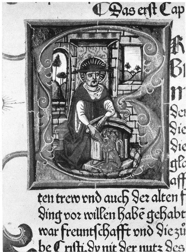
Abb. 2. Initiale B mit der Miniatur des hl. Hieronymus, Koberger, 1483

Alexander von Hales, der Legenda aurea des Jakob de Voragine, der Postille des Nikolaus von Lyra und anderen wurde am Anfang der Bände reichlich Raum für große Initialen ausgespart, den begabte Illuministen für kaufkräftige Liebhaber mit ihrer Kunst ausschmückten.