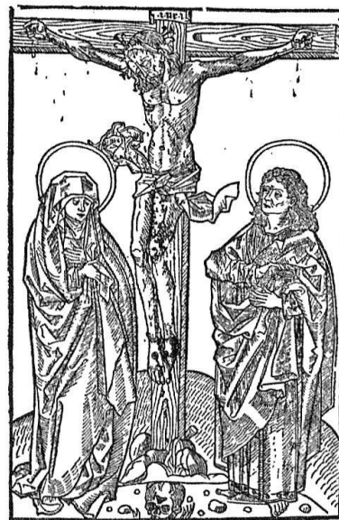
Basler Schnitt von ca. 1486