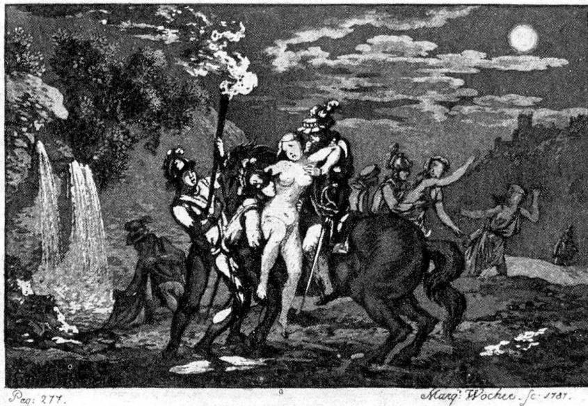
«Ritter von Scheideck-Geschichte». Aus Wernhard Hubers «Funken vom Heerde Seiner Laren»

Er nimmt den Künstler mit sich in die Apo- theke und bestellt ihm zur Ausstattung des Ban- des stehenden Fußes fünf Tafeln, schön in ge- tuschter Manier. Sein Bildnis nicht zu vergessen, damit auch der ferne Leser sehe, mit wem er's zu