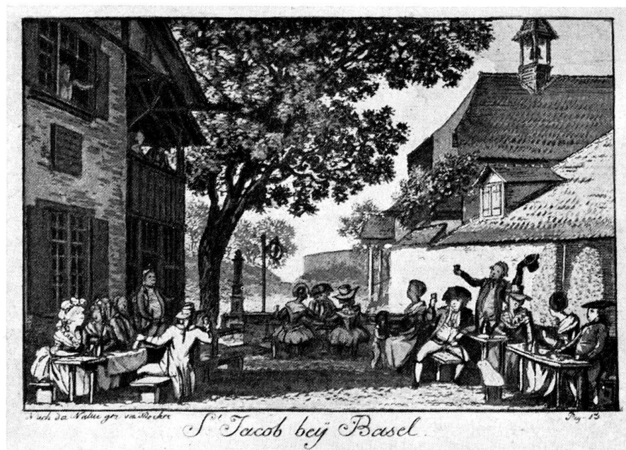
Aus Wernhard Hubers «Funken vom Heerde Seiner Laren»

ständen erscheinen läßt; sie enthalten, so wie er selbst es mit seinem Buche vorhat, in bunter Reihenfolge Dichtungen in gebundener und ungebundener Form. Jener Monsieur Claudius, der unter dem Decknamen Asmus schreibt, hat ihn überhaupt auf den Gedanken gebracht, es in die-