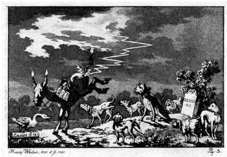
Aus Wernhard Hubers «Funken vom Heerde Seiner Laren»

untereinander gedruckt werden? Gereimtes und Ungereimtes gibt man sonst nicht im gleichen Bande heraus.»