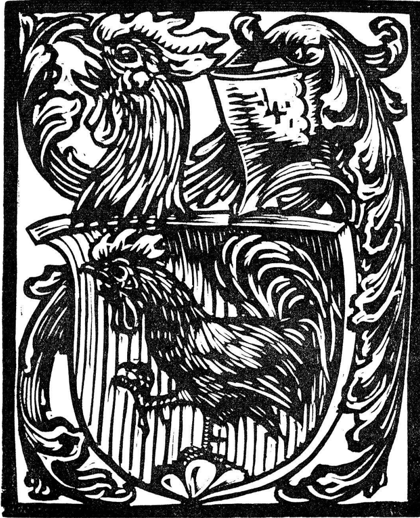
Original-Holzchnitt von Karl Hänyy: Das Wappen des Künstlers