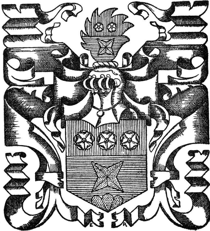
Fig. 4 : Ex-libris Dr. Alfred Comtesse.

termine par un pan qui vient se mêler à un cartouche déroulé au bas de la planche, portant la légende : Ex-libris Jacqueline . De ce cartouche, surgit à dextre un cheval issant, de fort belle allure, symbole des goûts hippophiles de la propriétaire. Cette planche, remarquablement équilibrée dans son asymétrie, est signée des initiales E. R. (fig. 3).