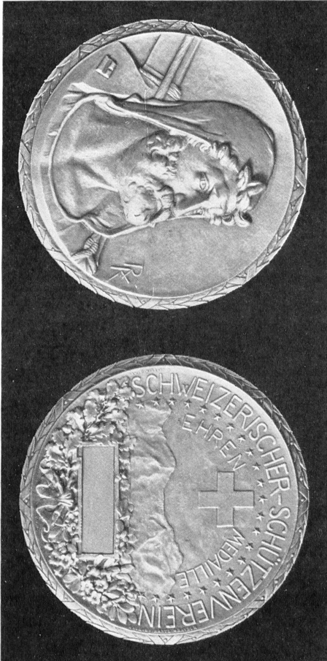
Tafel 8 : Ehrenmedaille des Schweizerischen Schützenvereins