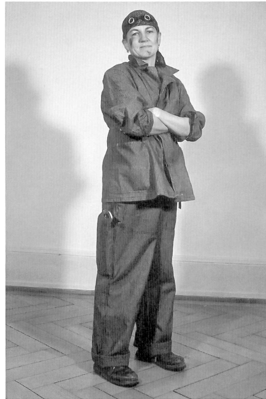
Öko-, Handwerks- oder Landleesbe

Du flirtest an einer Party mit einer attraktiven Unbekannten. Wie sieht sie aus?