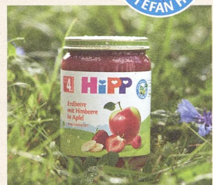
Klimaneutrale Produktion der Gläschen