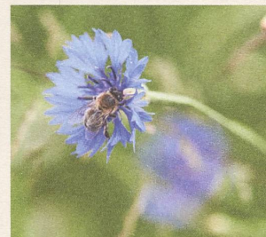
Intakte Natur durch biologische Vielfalt