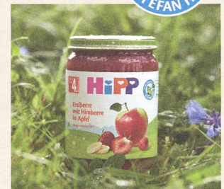
Klimaneutrale Produktion der Gläschen