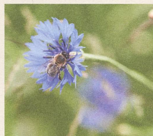
Intakte Natur durch biologische Vielfalt