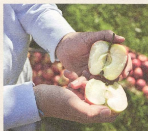
Hochwertige, geprüfte Rohstoffe