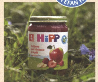
Klimaneutrale Produktion der Gläschen