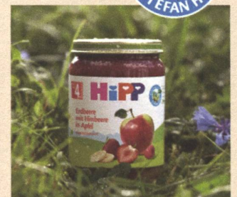
Klimaneutrale Produktion der Gläschen