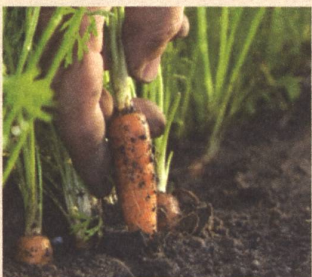
Bio-Anbau seit über 60 Jahren