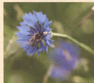
Intakte Natur durch biologische Vielfalt