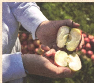
Hochwertige, geprüfte Rohstoffe