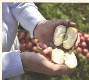
Hochwertige, geprüfte Rohstoffe