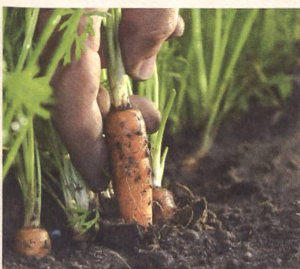
Bio-Anbau seit über 60 Jahren