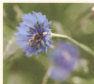
Intakte Natur durch biologische Vielfalt