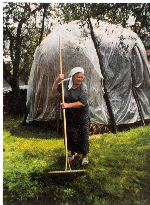
Das Gras im Hausgarten wird für den Winter gespart.