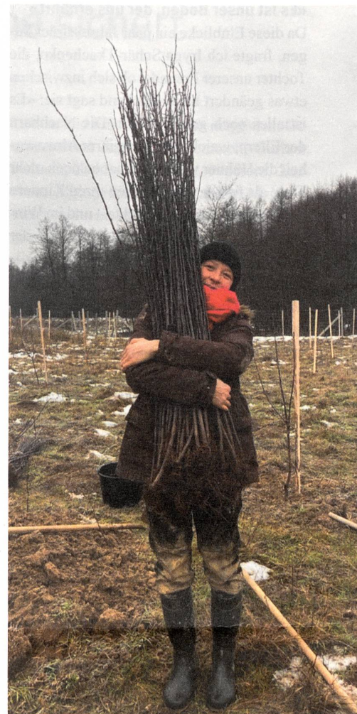
Freude über die ersten Schritte im Hochstammprojekt zur Aufwertung robuster alter Obstsorten.

In enger Zusammenarbeit mit der ukrainischen NGO CAMZ hat der Schweizer Verein Parasolka in der transkarpatischen Stadt Tyachiv (Tjatschiw) ein Wohnheim Parasolka als Modellprojekt, realisiert. Dort können kognitiv beeinträchtigte junge Erwachsene aus dem Kinderheim Vilshany seit 2009 als Alternative zum desolaten Leben in einer psychiatrischen Klinik wohnen und finden eine sinnvolle Beschäftigung. Ganz wichtig ist dabei die Landwirtschaft, die auch zur Selbstversorgung beitragen muss. Auf dem Gelände von rund 2,17 Hektaren wird ohne chemische Düngemittel die ganze Fülle von Obst und Gemüse angebaut. Das meiste wird eingemacht oder tiefgefroren. Auch hier gibt es ein paar Nutz- und Haustiere: Kühe, Schweine, Hühner, Enten, Katze und Hund. Seit Kriegsausbruch ruht die Weiterentwicklung der Parasolka-Projekte. Im Kinderheim und im Wohnheim wurden zusätzlich aus dem Osten geflüchtete Menschen aufgenommen, die Partnerinnen der NGO CAMZ engagieren sich mit sehr viel Einsatz in der Nothilfe. In ihrem Jubiläumsschrieb Direktorin Oksana Lukach unter anderem: «Auch wenn bei uns zum Glück keine Kämpfe stattfinden, sind doch sehr viele, vor allem Männer, jetzt an der Front, andere werden nach und nach mobilisiert. Die Menschen unserer Region helfen mit Nahrungsmitteln: Gemüse wird eingelegt, getrocknet, Gebäck wird zubereitet und sogar Holubzi (Kohlrouladen) werden zubereitet und an die Front geschickt.» ●