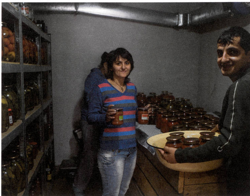
Wie vielerorts in der Ukraine ist auch der Vorratskeller im Wohnheim Parasolka gut gefüllt.