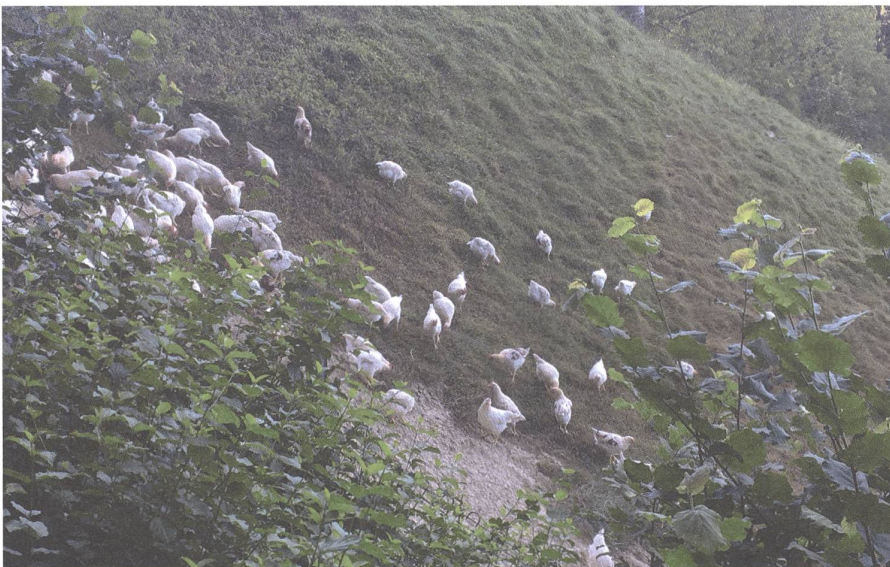
Auslauf für Mastgeflügel: Bruderhähne auf der Weide vom Biohof Luggli.

Der Initiative einen Gegenentwurf gegenüberzustellen, ist aber noch aus weiteren Überlegungen wichtig. Einen Abstimmungskampf wie letzten Juni, so eine Schlamm Schlacht möchte wohl niemand