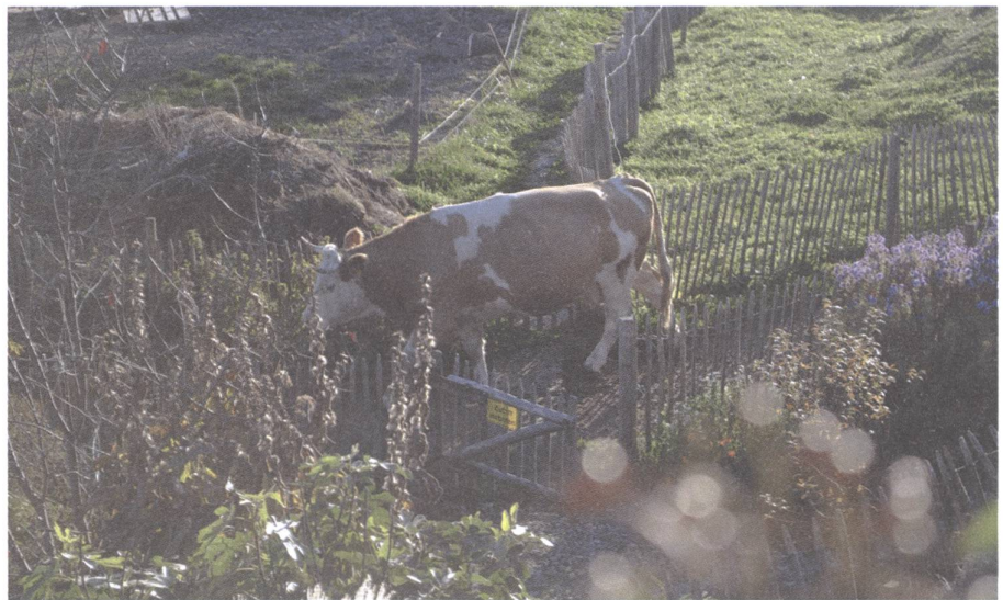
Regelmässiger Weidegang verbessert die Tiergesundheit: Kuh vom Biohof Schüpfenried.

Das Thema Massentierhaltung hat ein hohes Mobilisierungspotenzial , denn das Tierwohl ist erfreulicherweise vielen Menschen ein grosses Anliegen. Trotzdem müssen wir uns nichts vormachen: Die Agrarlobby hat den Einfluss und die Mittel, sowohl die Alternativen zur Initiative im Parlament zu versenken als auch die Volksabstimmung zu gewinnen. Die gängigen Angstmacher-Argumente wie höhere Preise oder nicht umsetzbare Anforderungen werden auch hier eingesetzt werden und ihre Wirkung nicht verfehlen. Die Frage ist einfach, wer wirklich davon profitiert. Denn die Kleinbauern-Vereinigung ist überzeugt, dass bei einer Ablehnung der Initiative oder eines allfälligen Gegenentwurfs die Bäuerinnen und Bauern nur verlieren können.