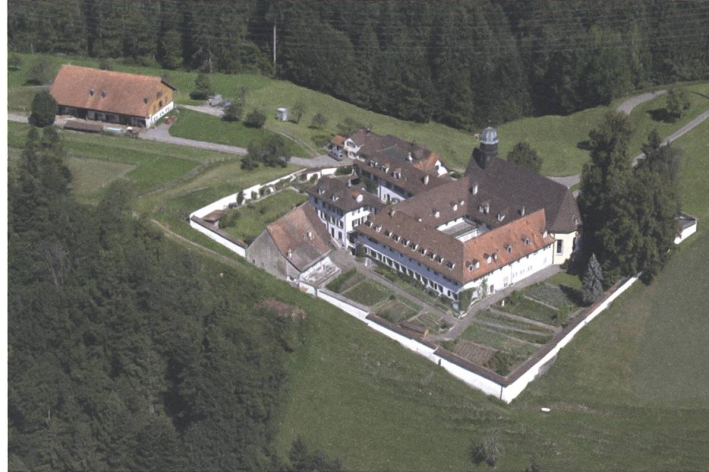
Der Bauernhof des Frauenklosters Wonenstein in Niedersteufeln AR war 25 Jahre lang Lebens- und Arbeitsort.

Am Klosterbetrieb, wo ich gearbeitet habe, wird dieser Wandel sichtbar. Der grosszügige Stall wurde 1896 gebaut.