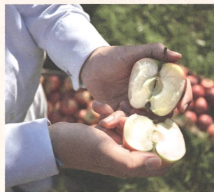
Hochwertige, geprüfte Rohstoffe