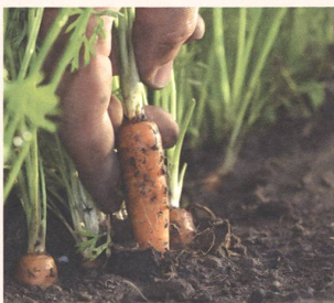
Bio-Anbau seit über 60 Jahren