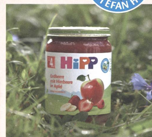
Klimaneutrale Produktion der Gläschen