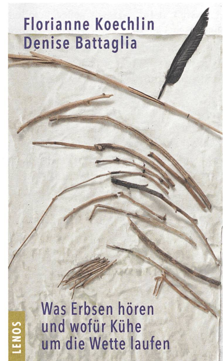
Florianne Koechlin und Denise Battaglia: Was Erbsen hören und wofür Kühe um die Wette laufen. Verblüffendes aus der Pflanzen- und Tierwelt, 263 Seiten, September 2018.

Das Buch ist ein Lesegenuss und zugleich voller Wissen aus der Welt der wissenschaftlichen und bäuerlichen Erkenntnisse. ●