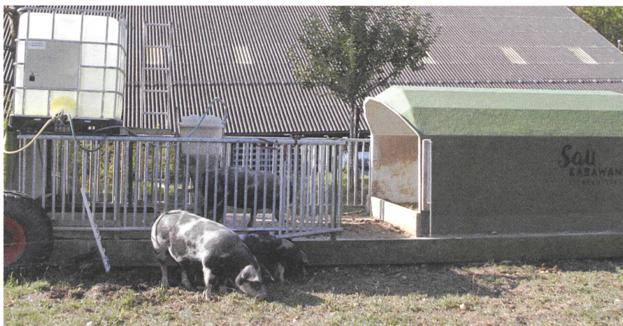
«Saukarawan» – Bürgis Methode, um bis zu zehn Mastschweine bodenschonend und arbeitsparend im Freiland zu halten.

Dem Hühnermobil und dem Schweinekarawan folgen deshalb im nächsten Jahr jeweils Hausgarten und mobiles Gewächshaus. Es gibt weniger Schnecken, der Boden ist gut gelockert und bereits gedüngt. Grosse Kartoffeln, wenig Schneckenfrass und ganz allgemein viel feines Gemüse haben diesen Sommer schon gezeigt, dass das Modell «Schweinemobil» und der Wechsel von Hühnerweide, Schweineweide und Gar-