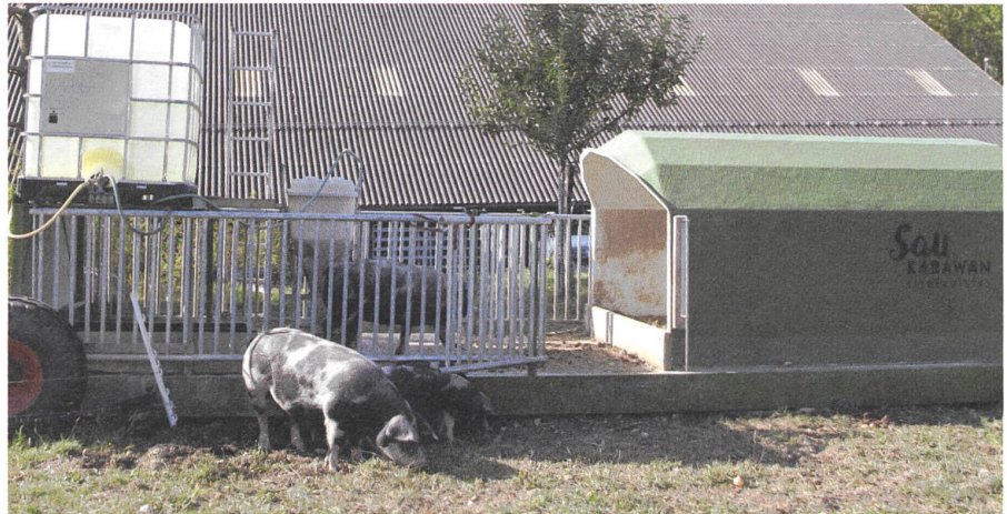
«Saukarawan» – Bürgis Methode, um bis zu zehn Mastschweine bodenschonend und arbeitsparend im Freiland zu halten.

Dem Hühnermobil und dem Schweinekarawan folgen deshalb im nächsten Jahr jeweils Hausgarten und mobiles Gewächshaus. Es gibt weniger Schnecken, der Boden ist gut gelockert und bereits gedüngt. Grosse Kartoffeln, wenig Schneckenfrass und ganz allgemein viel feines Gemüse haben diesen Sommer schon gezeigt, dass das Modell «Schweinemobil» und der Wechsel von Hühnerweide, Schweineweide und Gar-