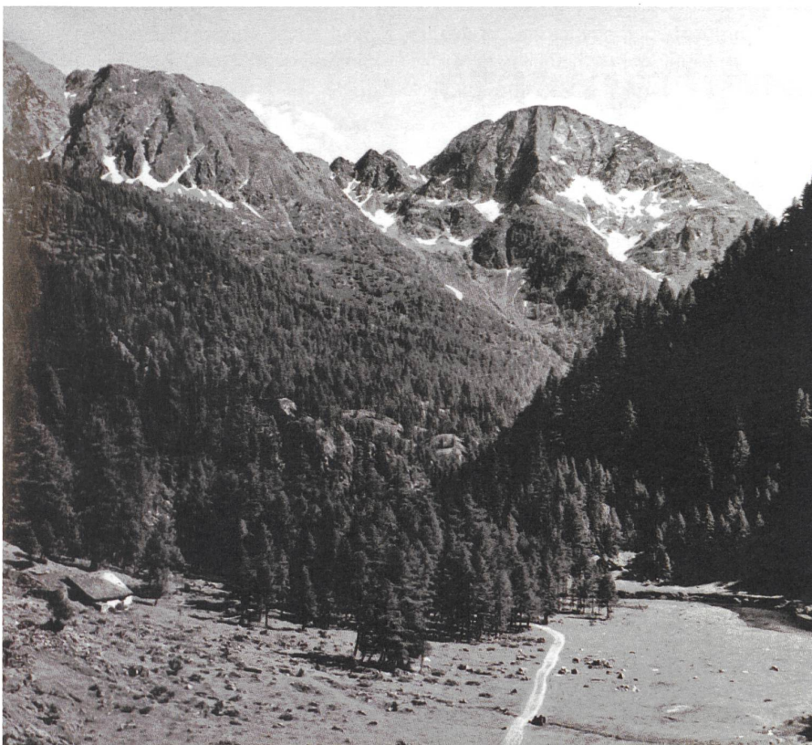
Das Valle Sambuco oberhalb Fusio im Jahr 1950, bevor es unter Wasser gesetzt wurde.

Wie alle Täler des Tessins hat sich auch das Maggiatal entvölkert. Seit 1850 haben die oberen Täler 55% (Val Lavizzara) bis 83% (Val Rovana) der Bewohner verloren. Die Bevölkerung des Ortes Campo Valle Maggia entspricht heute 12% der von 1850 und 5% von jener von 1680.