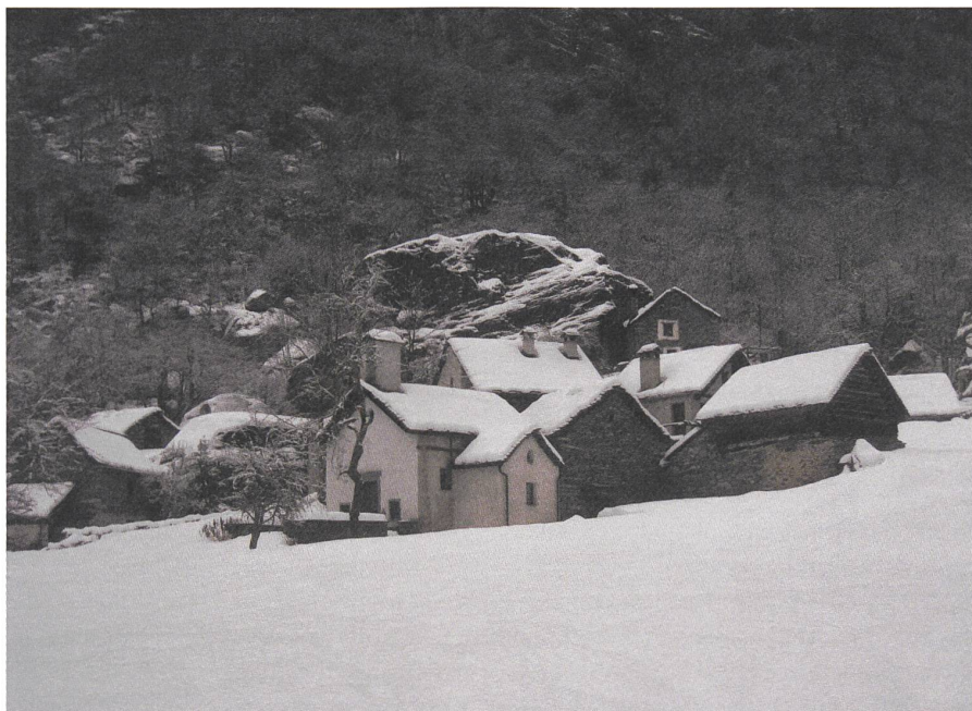
... und eine alte Siedlung, beide im Val Bavona.

Wie viele Expertisen zum Niedergang der peripheren Regionen wurden gemacht! Sie haben wenig oder nichts bewirkt, im Gegenteil. Auch die Regionalplanung hat, vorsichtig gesagt, relativ wenig gebracht; ich vermute, sie war zu rational und einseitig ökonomisch ausgerichtet. Sie hat wenig Enthusiasmus bewirkt. Das Problem war und ist, dass die Seele nicht einbezogen wurde. Die Seele ist die Kraft, die eine Brücke zwischen Tradition und Moderne bilden kann. Hat die heutige Politik verstanden, dass ohne Seele nichts geht? ●