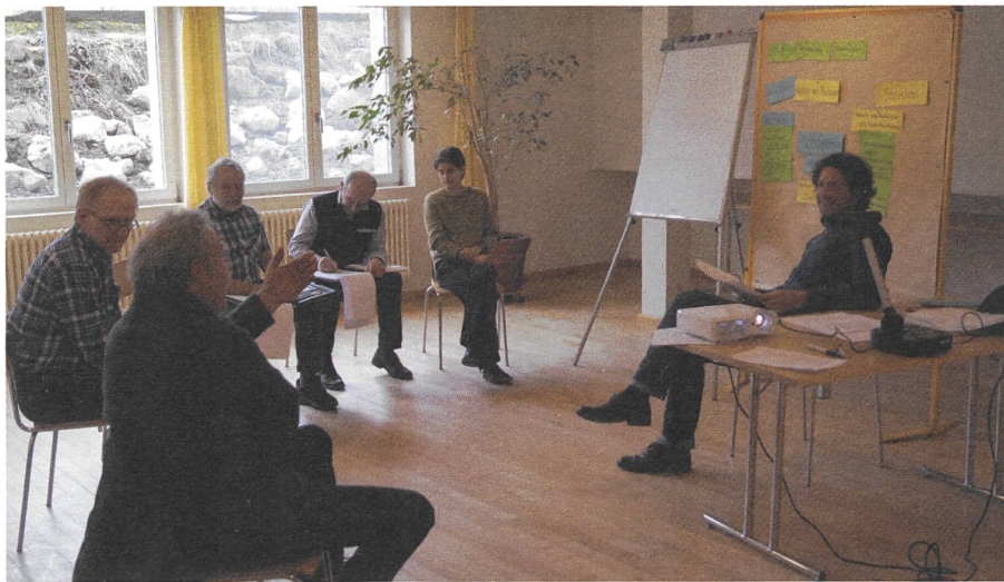
Beim Möschberggespräch 2016 wurde im Plenum und in fünf Kleingruppen gearbeitet. Hier eine Gruppe zum Thema 'Kontrollen'.