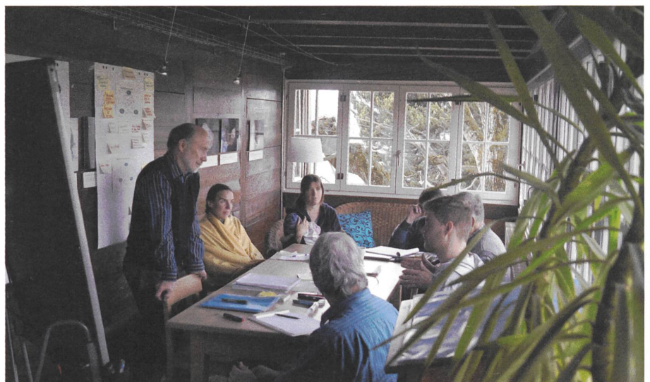
Gruppe urbane und stadtnahe Landwirtschaft