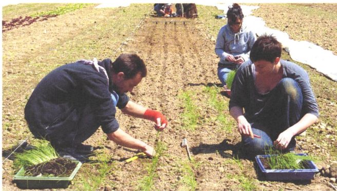
Durch die Mitarbeit bekommen die KonsumentInnen einen direkten Bezug zur Landwirtschaft. Die Wertschätzung für die Nahrungsmittel steigt und für den Betrieb eröffnet dies neue Perspektiven.