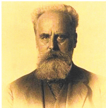
Ernst Laur, rund 40 Jahre führend in Schweizer Agronomie und «Bauernpolitik».

Der Verein Midgard im bayerischen Traunstein gibt eine Vierteljahreszeitschrift «Umwelt & Aktiv – das Magazin für gesamtheitliches Denken» heraus. Als aktuelle Pressemitteilung vom 11. Mai 2013 wird ein Aufruf «Bauernhöfe statt Tierfabriken» der Arbeitsgemeinschaft bäuerliche Landwirtschaft (AbL), des Bundes Naturschutz (BUND) und weiterer Organisationen wiedergegeben. Es wird gegen die Privatisierung von Wasser und für die Weisheit von Märchen geschrieben. Man findet dort Tipps zum Gärtnern, Aufrufe zum Tierschutz und die Redaktion äussert den Anspruch, auch «unbequeme Themen» zu behandeln. Artikel über Brauchtum und germanische Mythen sollen die kulturelle Seite des Heimatschutzes stärken. Die Heimat müsse vor den «Global