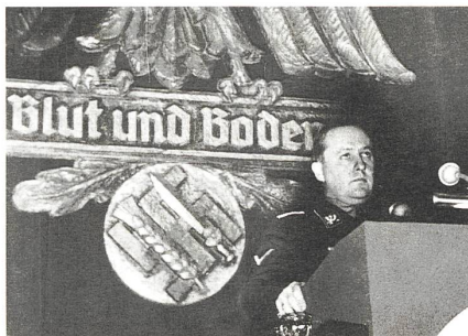
Minister Darré 1937 auf einer Kundgebung des «Reichsnährstandes».

Politologen haben einen speziell geschulten Blick auf die von ihnen so genannte «Ökologie von Rechts». Ihre Analysen zielen vor allem darauf, Strategien extremer Gruppierungen aufzudecken, die mithilfe (scheinbarer) Gemeinsamkeiten und mehrdeutiger «Konsens»-Argumente hoffähig werden und ihre An-sichten in akzeptierte Foren einbringen wol-len . Solche Analysen zeigen auf, wie man von unverfänglichen Meinungen in verfängliche Argumentationsfallen geraten kann. Als Stel-lungnahme und Handhabe, um Extremisten nicht bei sich dulden zu müssen, hat der Bio-land-Verband 2012 eine abgrenzende Formu-lierung in den Zweckartikel seiner Verbands-satzung aufgenommen. – Wertvoll ist auch, bei unbekanntem interessanten Gesprächspartnern zu recherchieren, was diese Person sonst noch macht. Als jemand am Bioforum Schweiz fürs Möschberggespräch 2013 einen «total faszi-nierenden Mann» als Referenten vorschlug, den er jüngst kennengelernt habe, konnten an-dere per Internetrecherche zu dessen Aussagen und Kooperationen feststellen, dass die Ein-ladung ein grosser Fehler gewesen wäre. Von Leuten im Biolandbau höre ich öfters die Meinung, Vielfalt sei der sicherste Schutz