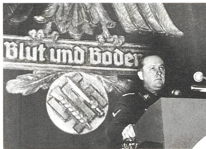
Minister Darré 1937 auf einer Kundgebung des «Reichsnährstandes».

Politologen haben einen speziell geschulten Blick auf die von ihnen so genannte «Ökologie von Rechts». Ihre Analysen zielen vor allem darauf, Strategien extremer Gruppierungen aufzudecken, die mithilfe (scheinbarer) Gemeinsamkeiten und mehrdeutiger «Konsens»-Argumente hoffähig werden und ihre An-sichten in akzeptierte Foren einbringen wol-len . Solche Analysen zeigen auf, wie man von unverfänglichen Meinungen in verfängliche Argumentationsfallen geraten kann. Als Stel-lungnahme und Handhabe, um Extremisten nicht bei sich dulden zu müssen, hat der Bio-land-Verband 2012 eine abgrenzende Formu-lierung in den Zweckartikel seiner Verbands-satzung aufgenommen. – Wertvoll ist auch, bei unbekanntem interessanten Gesprächspartnern zu recherchieren, was diese Person sonst noch macht. Als jemand am Bioforum Schweiz fürs Möschberggespräch 2013 einen «total faszi-nierenden Mann» als Referenten vorschlug, den er jüngst kennengelernt habe, konnten an-dere per Internetrecherche zu dessen Aussagen und Kooperationen feststellen, dass die Ein-ladung ein grosser Fehler gewesen wäre. Von Leuten im Biolandbau höre ich öfters die Meinung, Vielfalt sei der sicherste Schutz