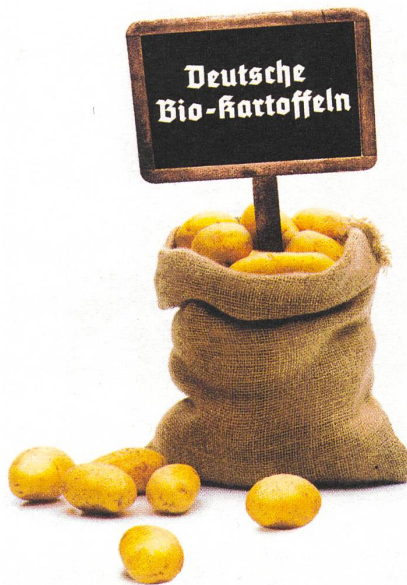
Titelbild der Zeitschrift «politische Ökologie», Dezember 2012, Schwerpunktheft «Ökologie von Rechts».

All das fand sich später auch beim Nazi-Minister Darré wieder, der aber zusätzlich auch über das Bürgerliche Gesetzbuch und die Demokratie schimpfte. Darré verband Zivilisationskritik mit Rassenideologie: Kurz zusammengefasst stand «Boden» bei Darré für die Gesamtheit von Natur- und Umweltfaktoren, die im Laufe der Evolution die Entwicklung des «Blutes», das heisst der Menschen und Völker und ihrer inneren Überzeugungen, geprägt habe. Und zwar nicht nur im Sinne flexibler Umweltanpassung, sondern sozusagen als existenzielle Formung;