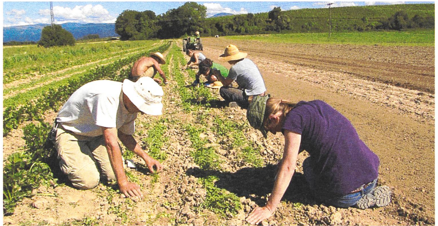
Grosses, gemeinschaftliches Rübli-Jäten von unstandardisierten Arbeitskräften.

Vielfalt ist der Gartenkooperative wichtig. Es werden ausschliesslich samenfeste Sorten angebaut. Die Fruchtfolge ist ausgeklügelt und langfristig. Lukas erklärt mir, dass sie die Flä-