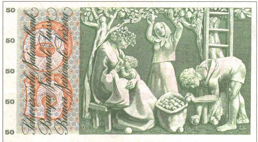
Wirtschaften als Wiederherstellung der Lebenskräfte: «Apfelernte» von Pierre Gauchat auf der Rückseite der 50-Schweizerfrankennote aus den 1950er Jahren.

Mein Selbstversorgungsansatz zielt nun darauf ab, vor allem die drei unteren Schichten dieses Kuchens ins Auge zu fassen, zu pflegen und dort nach Lösungen zu suchen. Die Geldwirtschaft betrachte ich nur als zusätzliche Möglichkeit. Primär geht es mir auch darum, die Lebenskräfte und -quellen so zu nutzen, dass sie sich wiederherstellen. Der Zweck des Wirtschaftens, so wie ich es verstehe, ist die Wiederherstellung. Der Zweck des Essens besteht – abgesehen von der Freude, die es mir bereitet – darin, sicherzustellen, dass meine Kraft sich erneuern kann. Der ökonomische Prozess ist also ein Wiederherstellungsprozess. Wir erwirtschaften auf Basis der Natur und der Agrikultur – dem Erbe der Vorfahren – und durch unser gärtnerisches Tun z. B. Äpfel und Gemüse. Diese heranwachsenden Lebensmittel bereiten wir selber als Nahrung zu und essen sie. Dieses Essen wiederum leistet einen wesentlichen Beitrag dazu, dass unser Leben erhalten bleibt und unsere Kraft wiederhergestellt wird. Die Natur, bzw. was wir gemeinhin als Natur bezeichnen, zeigt an vielen Beispielen, dass sie durchaus imstande ist, diesen «Lebensprozess-Wirtschaftspro-