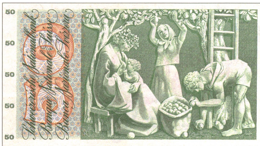
Wirtschaften als Wiederherstellung der Lebenskräfte: «Apfelernte» von Pierre Gauchat auf der Rückseite der 50-Schweizerfrankennote aus den 1950er Jahren.

Mein Selbstversorgungsansatz zielt nun darauf ab, vor allem die drei unteren Schichten dieses Kuchens ins Auge zu fassen, zu pflegen und dort nach Lösungen zu suchen. Die Geldwirtschaft betrachte ich nur als zusätzliche Möglichkeit. Primär geht es mir auch darum, die Lebenskräfte und -quellen so zu nutzen, dass sie sich wiederherstellen. Der Zweck des Wirtschaftens, so wie ich es verstehe, ist die Wiederherstellung. Der Zweck des Essens besteht – abgesehen von der Freude, die es mir bereitet – darin, sicherzustellen, dass meine Kraft sich erneuern kann. Der ökonomische Prozess ist also ein Wiederherstellungsprozess. Wir erwirtschaften auf Basis der Natur und der Agrikultur – dem Erbe der Vorfahren – und durch unser gärtnerisches Tun z.B. Äpfel und Gemüse. Diese heranwachsenden Lebensmittel bereiten wir selber als Nahrung zu und essen sie. Dieses Essen wiederum leistet einen wesentlichen Beitrag dazu, dass unser Leben erhalten bleibt und unsere Kraft wiederhergestellt wird. Die Natur, bzw. was wir gemeinhin als Natur bezeichnen, zeigt an vielen Beispielen, dass sie durchaus imstande ist, diesen «Lebensprozess-Wirtschaftspro-