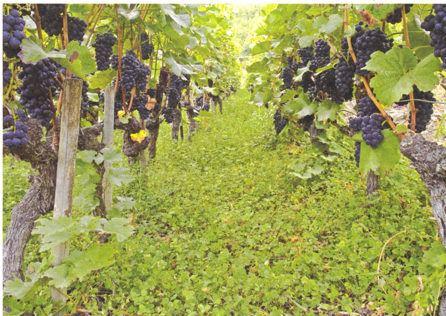
Gründüngung im Rebberg.

Der Kohlenstoff all des Öls und all der Kohle, die wir so sorglos verbrennen, war vor vielen Millionen Jahren einmal als CO 2 in der Atmosphäre. Er wurde von Pflanzen assimiliert und in pflanzlichem Zellgewebe fixiert. Doch bevor irgendwann Kohle oder Erdöl daraus entstanden, verrotteten die Pflanzen, bauten Humus auf, vergasteten als CO 2 oder CH 4 , um schliesslich erneut von Pflanzen aufgenommen zu werden. Jedes Kohlenstoffatom im Erdöl oder in der Kohle hat in seiner viele Millionen Jahre alten Geschichte unzählige Reisen durch die Atmosphäre, den Boden, durchs Meer und durch Muscheln, durch unzählige Pflanzen und Mikroorganismen erlebt. Jedes Kohlenstoffatom ist millionenfach genutzt worden, hat tausende Existenzen durchlaufen, ist immer wieder recycelt worden. Wie die Erde mit ihrem Kohlenstoff umgeht, ist das beste Beispiel für nachhaltiges Wirtschaften und zeigt zugleich, wie gefährlich es ist, die natürlichen Balancemechanismen ausser Kraft zu setzen. Für die Aufrechterhaltung des natürlichen Kohlenstoffkreislaufs spielen Pflanzen und Mikroorganismen die entscheidende Rolle. Je mehr die Industriegesellschaft die Pflanzen und Ökosysteme schwächt, desto näher rückt