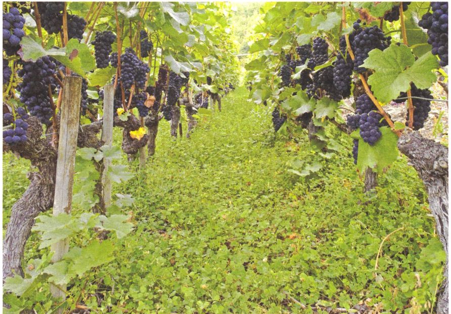
Gründüngung im Rebberg.

Der Kohlenstoff all des Öls und all der Kohle, die wir so sorglos verbrennen, war vor vielen Millionen Jahren einmal als CO 2 in der Atmosphäre. Er wurde von Pflanzen assimiliert und in pflanzlichem Zellgewebe fixiert. Doch bevor irgendwann Kohle oder Erdöl daraus entstanden, verrotteten die Pflanzen, bauten Humus auf, vergasteten als CO 2 oder CH 4 , um schliesslich erneut von Pflanzen aufgenommen zu werden. Jedes Kohlenstoffatom im Erdöl oder in der Kohle hat in seiner viele Millionen Jahre alten Geschichte unzählige Reisen durch die Atmosphäre, den Boden, durchs Meer und durch Muscheln, durch unzählige Pflanzen und Mikroorganismen erlebt. Jedes Kohlenstoffatom ist millionenfach genutzt worden, hat tausende Existenzen durchlaufen, ist immer wieder recycelt worden. Wie die Erde mit ihrem Kohlenstoff umgeht, ist das beste Beispiel für nachhaltiges Wirtschaften und zeigt zugleich, wie gefährlich es ist, die natürlichen Balancemechanismen ausser Kraft zu setzen. Für die Aufrechterhaltung des natürlichen Kohlenstoffkreislaufs spielen Pflanzen und Mikroorganismen die entscheidende Rolle. Je mehr die Industriegesellschaft die Pflanzen und Ökosysteme schwächt, desto näher rückt