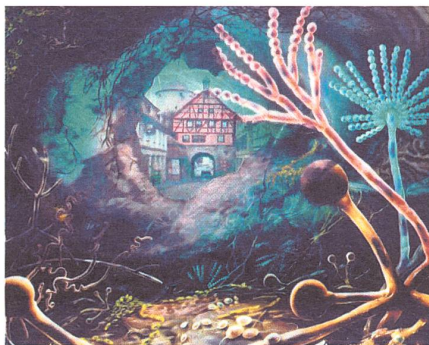
Blick in den Boden.

Das kann man nun auf vielen verschiedenen Stufen vornehmen. Auf allen aber lauern Gefahren, denen wir uns fast ausschliesslich nicht bewusst sind. Eine solche Stufe kann gut der