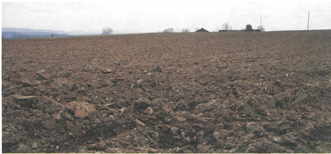
Eine lohnende Aufgabe: Für fruchtbaren Boden sorgen.

Der Boden unter den Füßen beschäftigt zwei Arbeitsgruppen des Bio-Forums, die sich an den letzten Möschberg-Gesprächen gebildet haben. Zum einen geht es um das grundlegende Element, aus dem unsere Nahrung spriesst. Zum anderen interessiert, wie der Bioanbau seine Beziehung zum Lebendigen nach aussen sicht- und begreifbar machen kann.