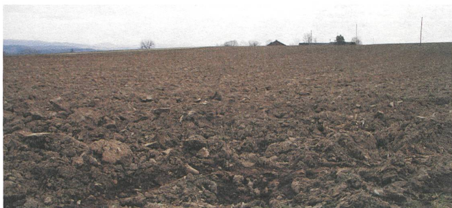
Eine lohnende Aufgabe: Für fruchtbaren Boden sorgen.

Der Boden unter den Füßen beschäftigt zwei Arbeitsgruppen des Bio-Forums, die sich an den letzten Möschberg-Gesprächen gebildet haben. Zum einen geht es um das grundlegende Element, aus dem unsere Nahrung spriesst. Zum anderen interessiert, wie der Bioanbau seine Beziehung zum Lebendigen nach aussen sicht- und begreifbar machen kann.