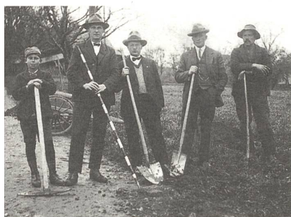
patenstich vor mehr als 75 Jahren.