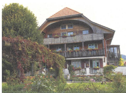
Der Mösberg heute. Hier trafen sich ...