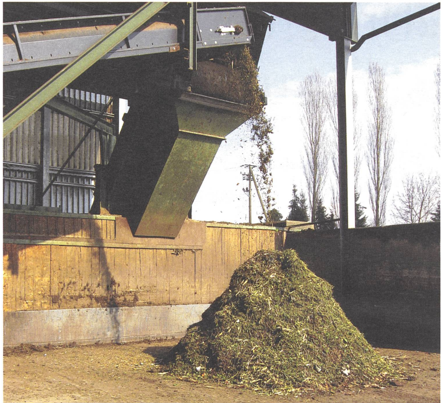
Die Kompostier- und Vergärungsanlage Allmig in Baar ist für ihn ein sinnvolles Beispiel...

Wir erhalten pro m 2 von der Sonne, je nach Klimazone und geographischer Lage,