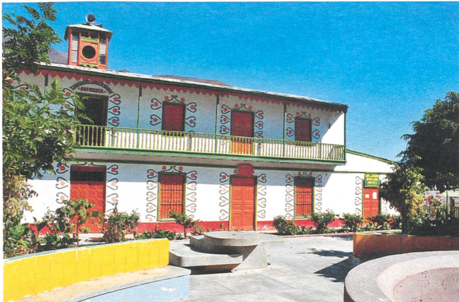
Mit den Farben und Mikrokrediten gab es auch neue Perspektiven: Buntes Dorf Antioquia im sonst graubraunen peruanischen Lurin-Tal.