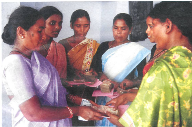
Fünf Frauen und eine Bankvertreterin: Wie hier in Indien kommen sie mit einem Gruppen-Mikrokredit wirtschaftlich gemeinsam weiter.

worden. Die Einkommenssituation verbessert sich rasant. Das Beispiel Antioquia zeigt, warum Mikrokredite nur ein Instrument sind, um Entwicklung voranzubringen: Ohne die bunte Vision von CIED nämlich hätten die Mini-Darlehen in Antioquia wohl kaum nachhaltigen Erfolg.