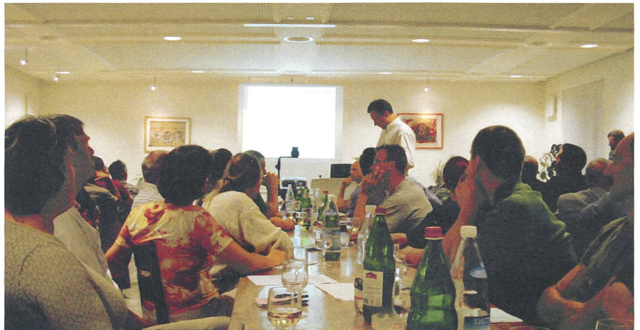
Zum Beispiel im Restaurant Brauerei in Sursee: BTA-KundInnen trafen sich mit der BTA-Spitze und einer Bio Suisse-Gastdelegation zu einem Informationsabend.

Jetzt stehen die eigenständige Zertifizierungsstelle als Teil der Bio Suisse und die Öffnung der Zertifizierung als zwei Lösungsansätze konkret zur Debatte. Für die Öffnung braucht es an der DV eine Zweidrittelsmehrheit, für die eigenständige Zertifizierungsfirma das normale Mehr. Bei der Öffnung verliert die bio.inspecta nur rund 20 Prozent ihrer Zertifizierungen, mit einer neuen Zertifizierungsstelle der Bio Suisse aber 80 Prozent! Das tut natürlich mehr weh. Die Präsidenten wollen nicht zuletzt deshalb an der DV vom 15. November beide Varianten in einem fairen Abstimmungsprozedere zur Abstimmung bringen. Nimmt es die Zweidrittelschürde, kann man die Öffnung machen. Hat die selbständige