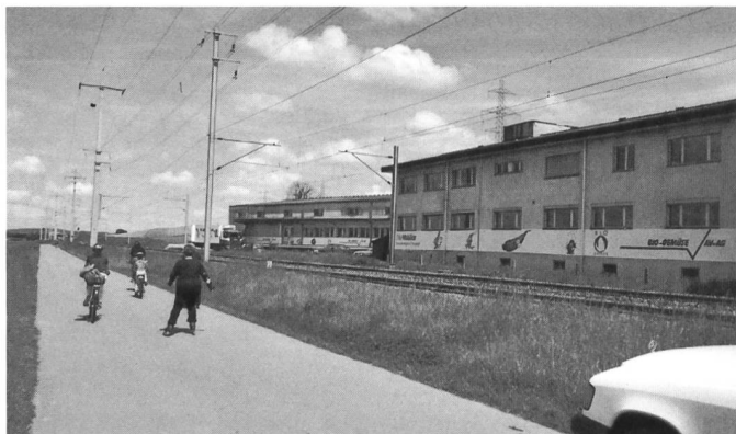
Die AV-AG Betriebs- und Bürogebäude liegen direkt am HPM-Weg der Expo 02. Ein Expo 02-Event, welches im Gegensatz zu praktisch allen anderen nach der Ausstellung nicht abgerissen wird, sondern weiter bestehen bleibt und an die Landesausstellung erinnern wird.

Human Powered Mobility Mit Musse und Muskelkraft ans Ziel kommen – das ist Inhalt des HPM-Projektes der Expo.