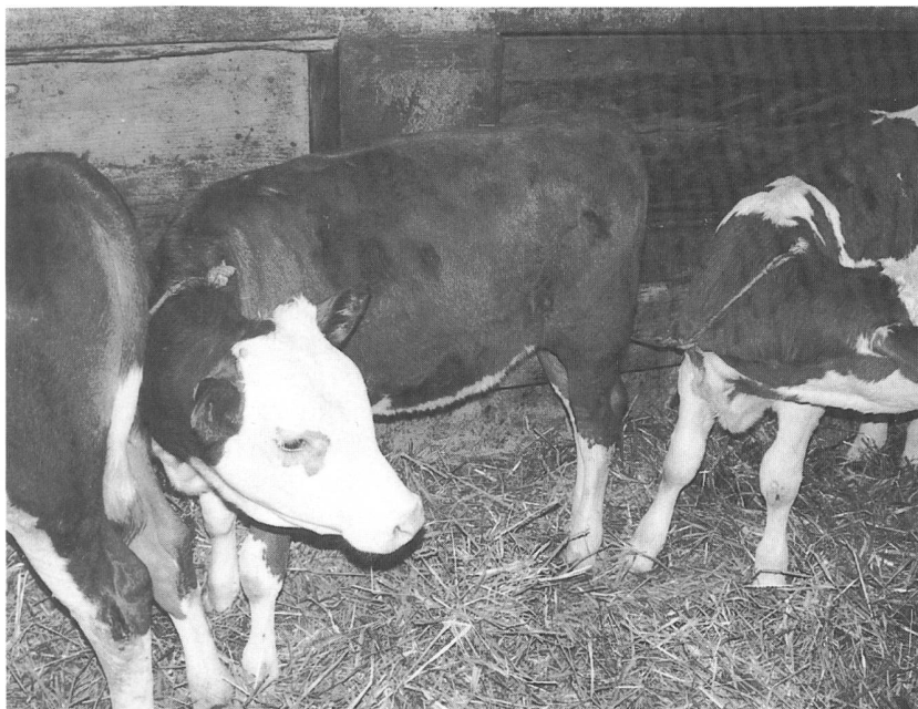
Das Anbinden von Rindvieh wird in 12 Jahren nicht mehr erlaubt sein.

Vor einiger Zeit ist in einem Entwurf die Anforderung aufge-