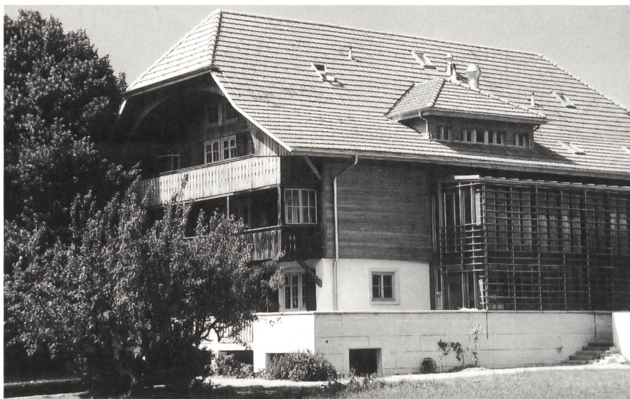
► «Nun stehst Du da...»

tragssaal erinnerte, war für mich Neuling doch etwas seltsam. Etwas allzu spartanisch, um nicht zu sagen so gar nichts Kostbares vermochte ich an Dir altem Haus zu erblicken. Ausser der Lage auf dem Hügel, wo Du stehst, vermochte ich auf den ersten Blick wirklich nichts Besonderes zu sehen.