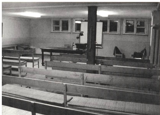
▲ «Der Kellerraum, der mich eher an die Kapelle einer Freikirche als an einen Vortragssaal erinnerte...»

Viele Menschen haben ihr Geld gerade wegen