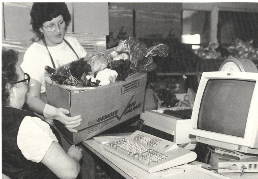
Bio per Post

Am Anfang standen Düngungsvorschriften und Anbauempfehlungen für die Produzenten. Entsprechend dem jeweiligen Stand der Erkenntnis wurden die Vorschriften immer strenger, um mit der Zeit den heutigen Stand zu erreichen. Gab es am Anfang noch Bio- und andere Lieferanten nebeneinander, so vermarktet die AVG jetzt nur noch Produkte mit der Knospen-Marke. Das hört sich gut und selbstverständlich an. Aber es steckt von allen Beteiligten eine riesige Überzeugungsarbeit dahinter.