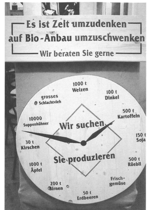
Ein starker gemeinsamer Auftritt von AVG und Biofarm an der LUGA 95