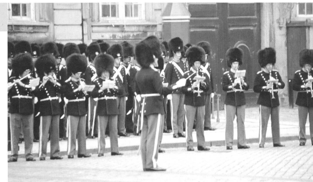
Wachtablösung im Königsschloss in Kopenhagen

Weiterfahrt nach Esbjerg. Dünenwanderung, dann mit dem Zug weiter nach Kopenhagen. Zimmerbezug im Hotel.