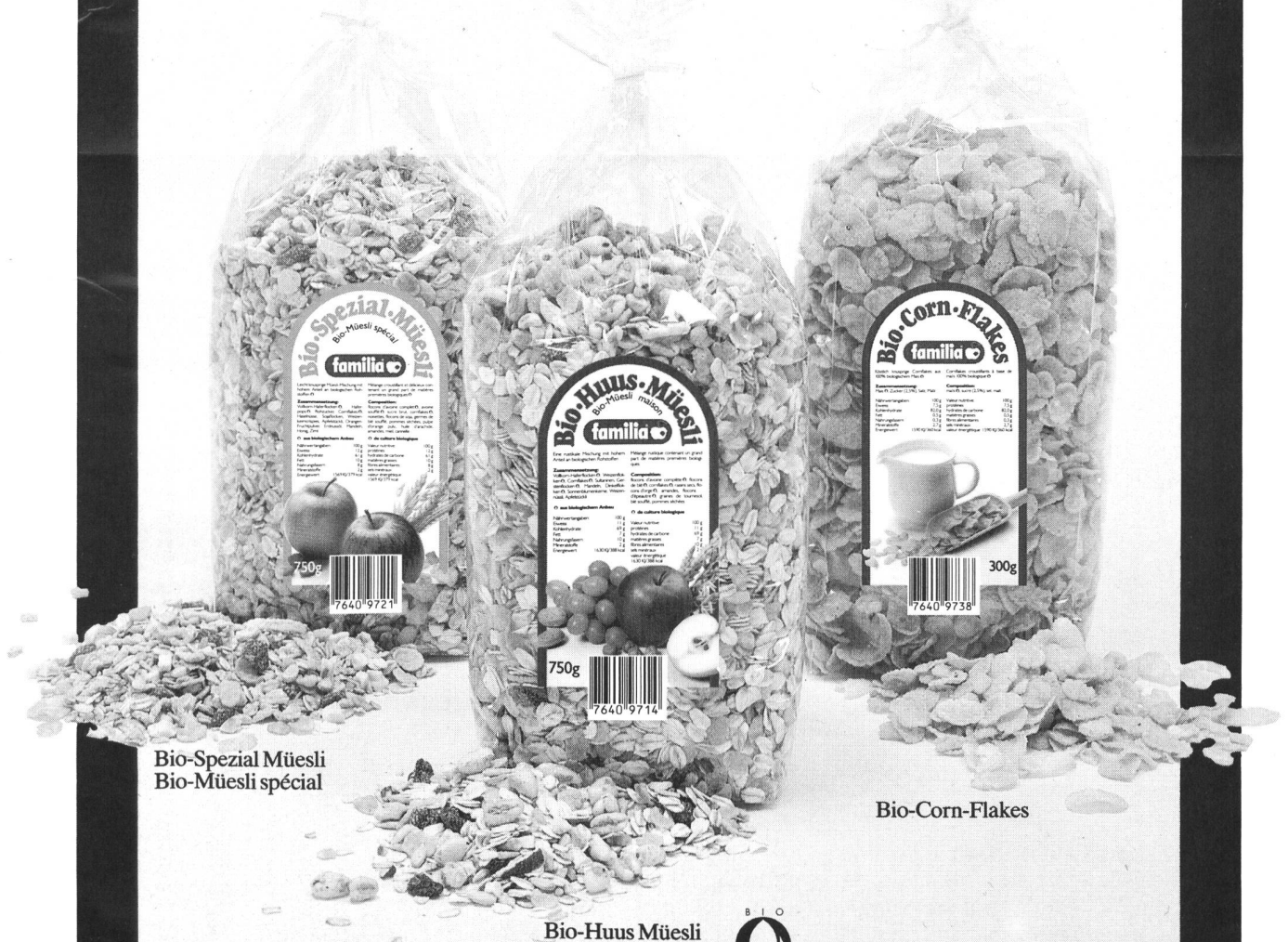
Bio-Spezial Müesli Bio-Müesli spécial

mit viel biologischen Rohstoffen in einfacher Verpackung beaucoup des matières premières biologiques, emballage simple