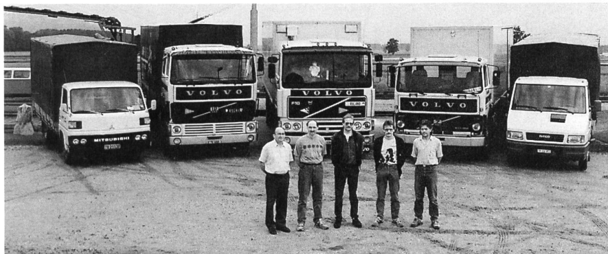
Das Transportteam der AVG

Das Transportteam der Bio-Gemüse AVG stellt sich vor