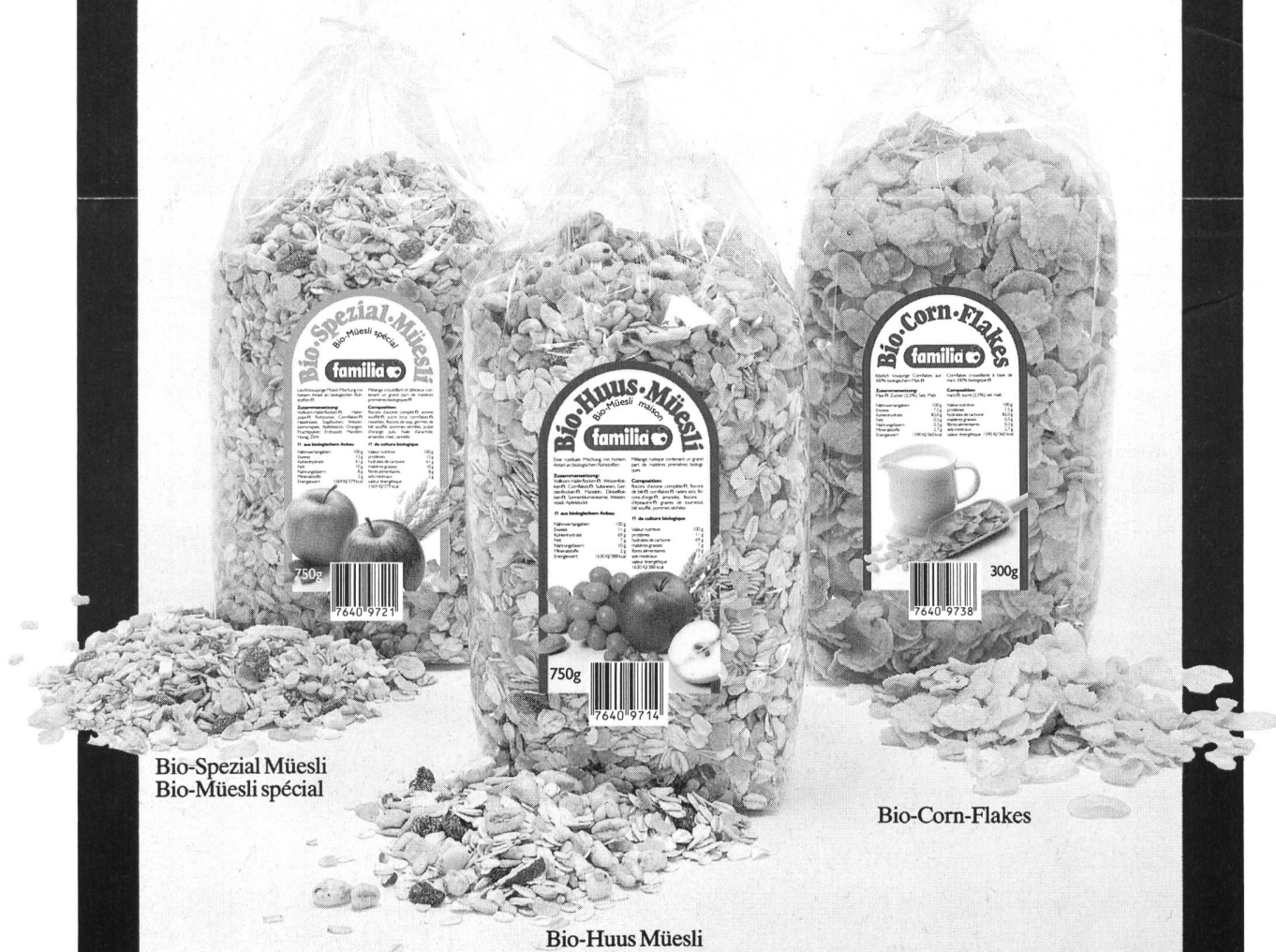
Bio-Spezial Müesli Bio-Müesli spécial

beaucoup des matières premières biologiques, emballage simple