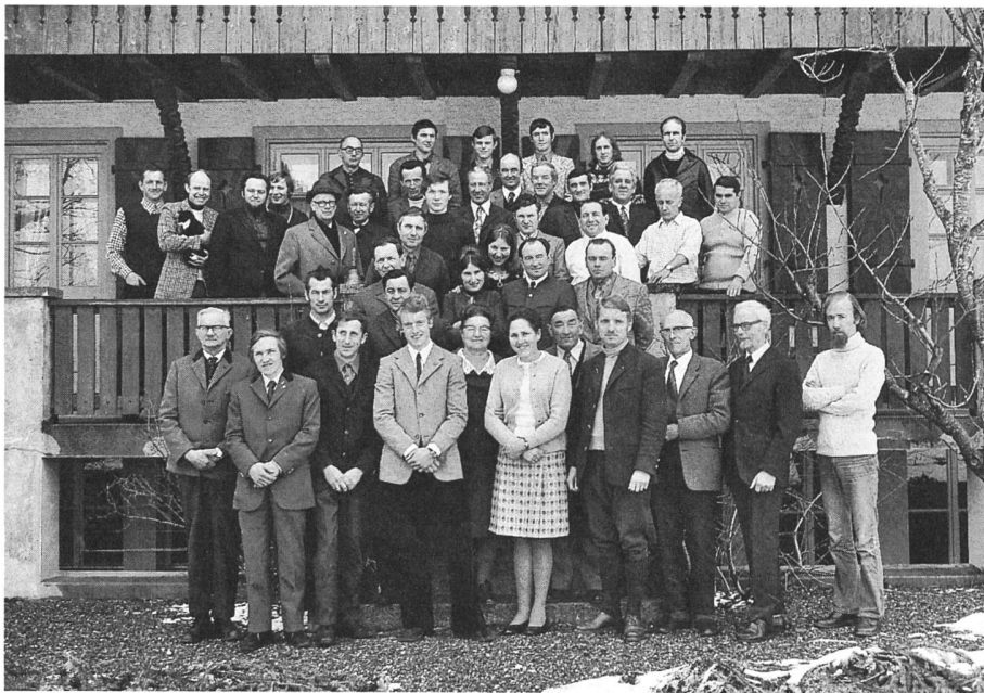
Gruppenbild vom Landbaukurs 1973 auf dem Mösberg. Die Teilnehmer stammen aus der Schweiz, Deutschland, Österreich und Frankreich