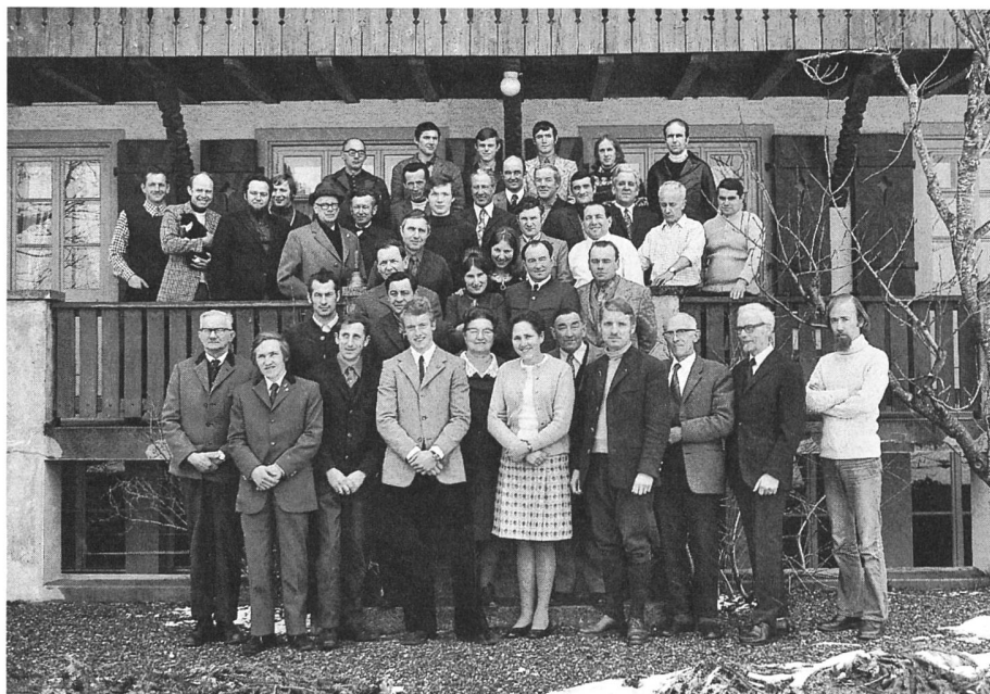
Gruppenbild vom Landbaukurs 1973 auf dem Möschberg. Die Teilnehmer stammen aus der Schweiz, Deutschland, Österreich und Frankreich