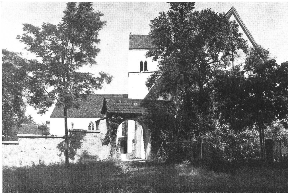
Die Kirche St. Martin KIRCHBÜHL BEI SEMPACH, KT. LUZERN