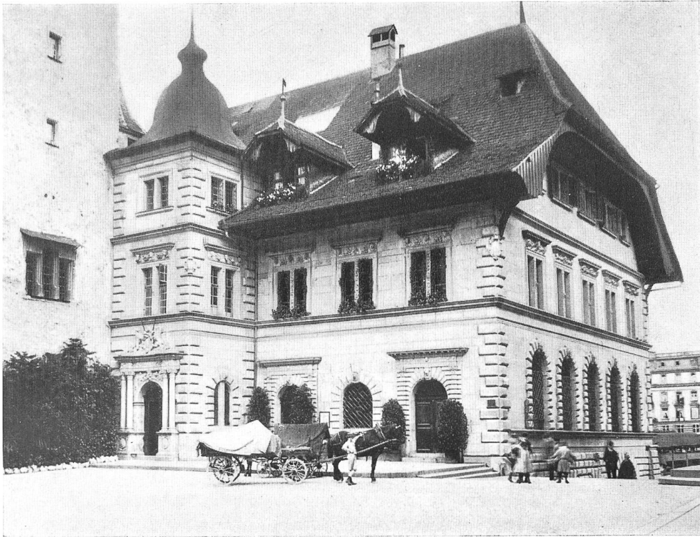
LUZERN. DAS RATHAUS