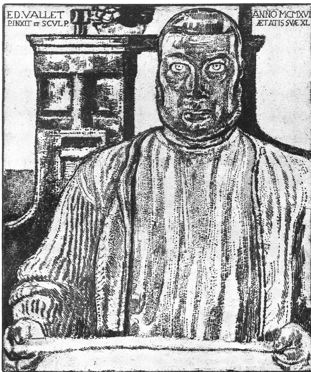
Selbstportrait, 1917 Radierung