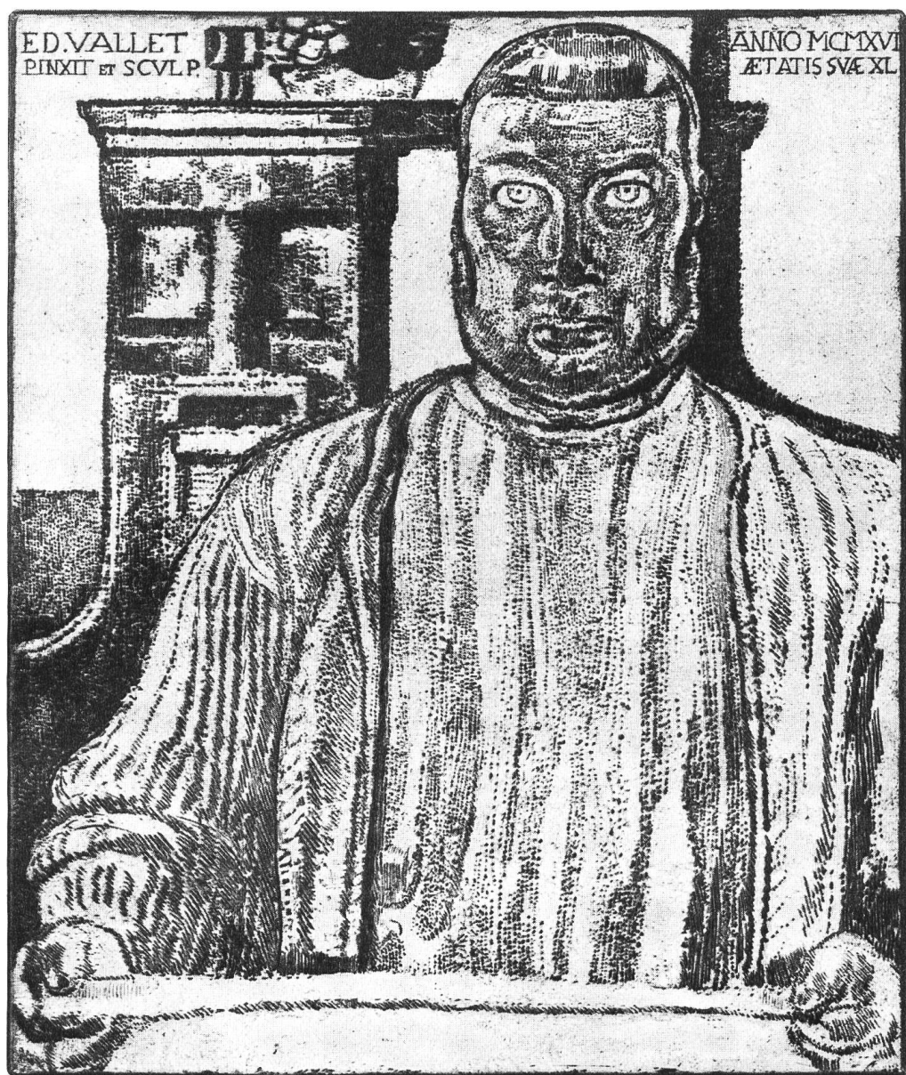
Selbstportrait, 1917 Radierung