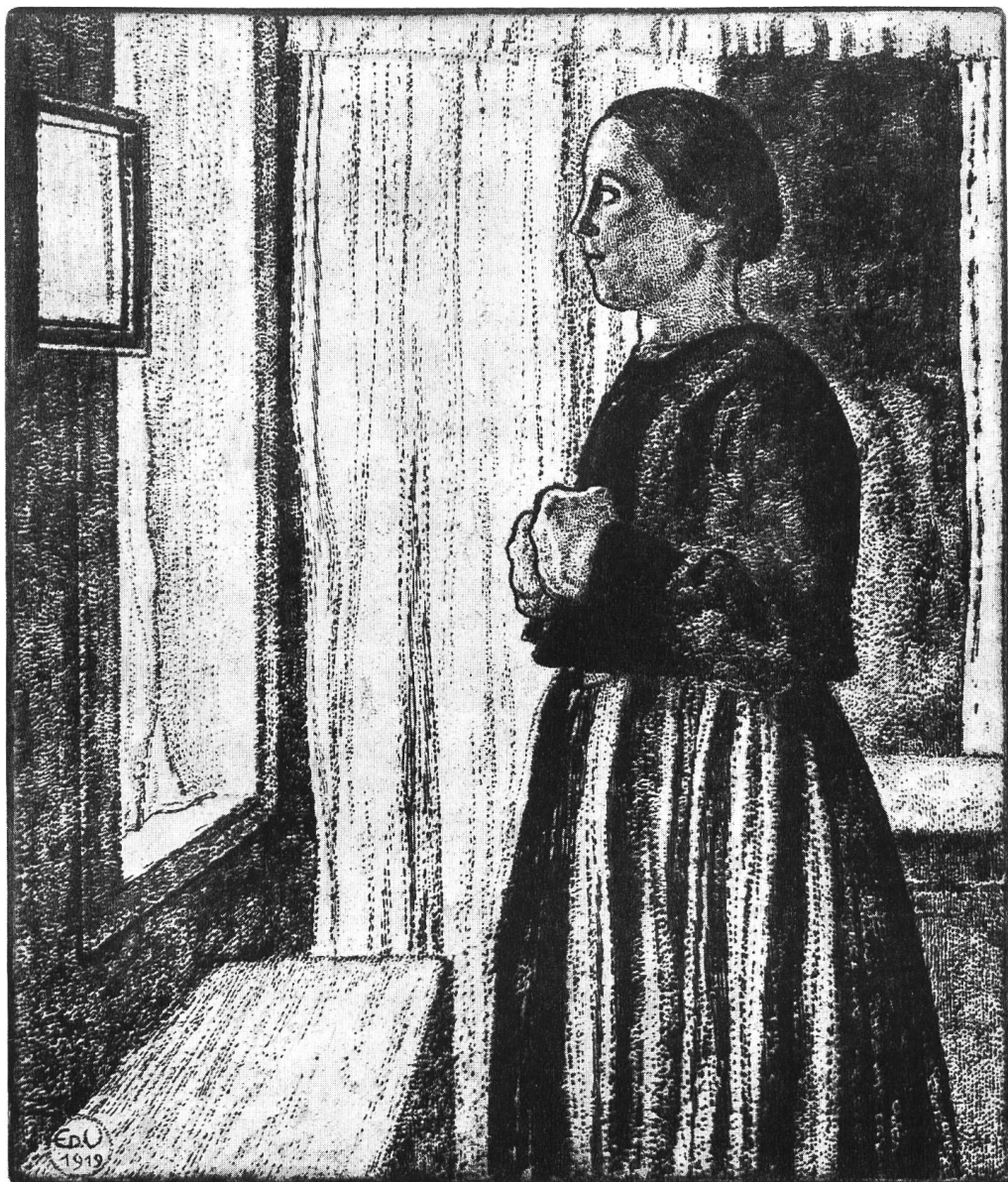
Vor dem Spiegel, 1919 Radierung (99)