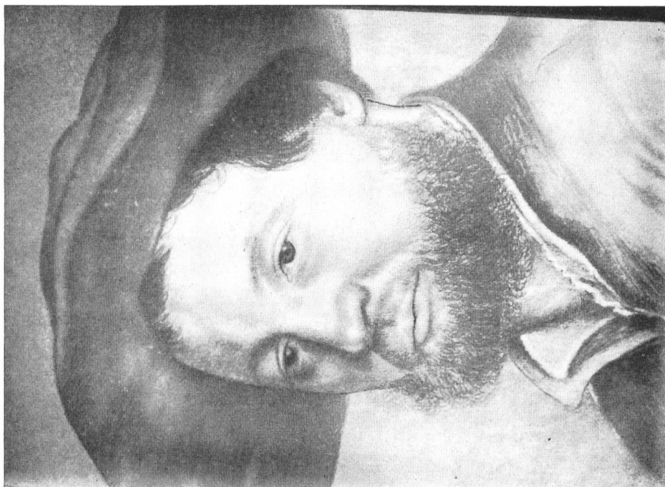
Abb. 5. Kombination von Abb. 1 und 2 (Taf. 10) wobei die obere Gesichtshälfte und die Kopfbedeckung vom Basler, die untere Gesichtshälfte und die Kleidung vom Florentiner Bilde stammen