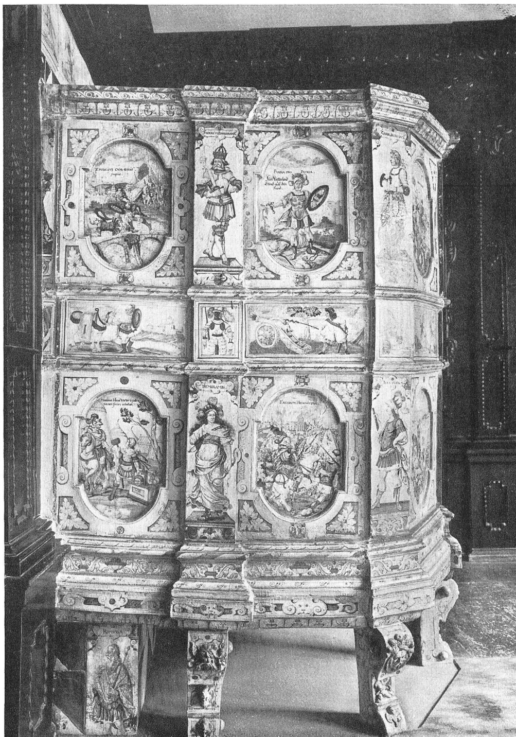
Buntbemalter Winterthurer-Ofen aus dem „Seehof“ in Küsnacht jetzt Zürich, Privatbesitz