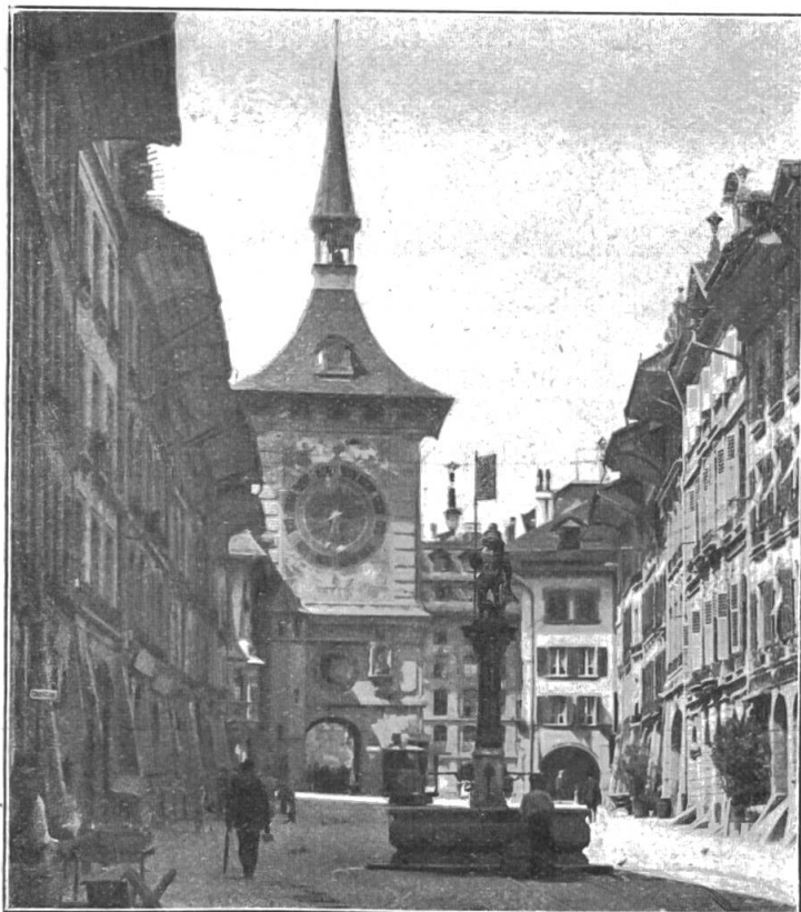
BERNE — LA TOUR DE L'HORLOGE (Vue extraite de la plaquette «BERNE»)

En préparation: LUCERNE, COIRE, LES VILLES VALAISANNES