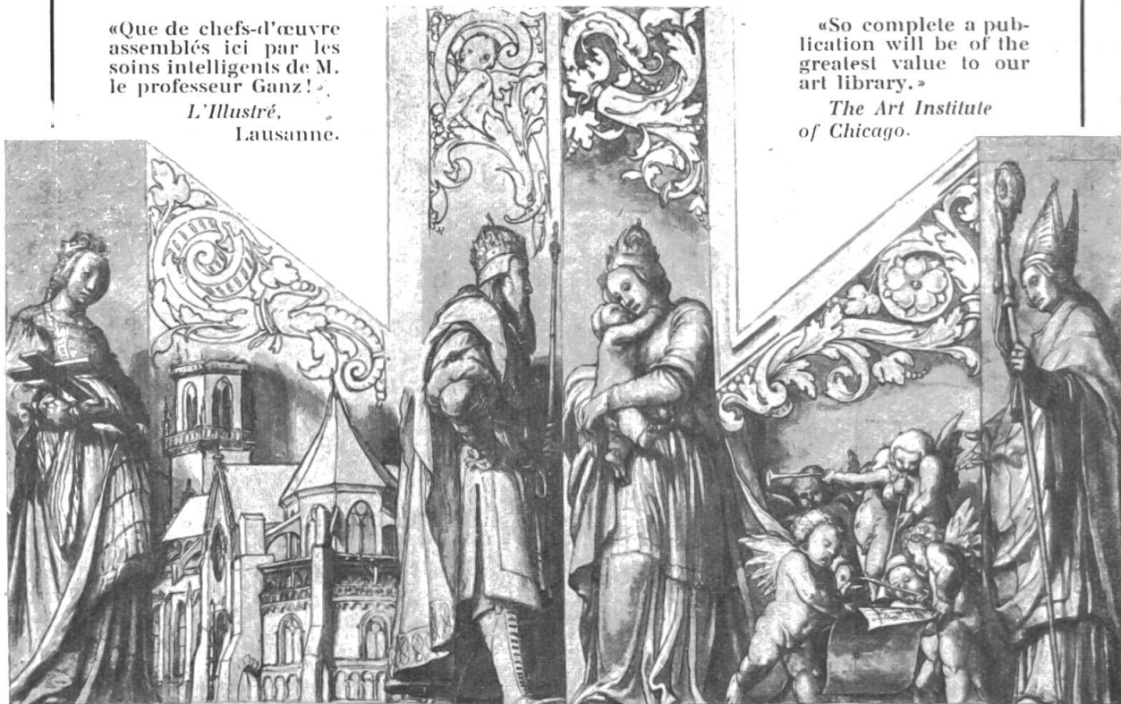
Etude pour les volets de l'orgue de la Cathédrale de Bâle.