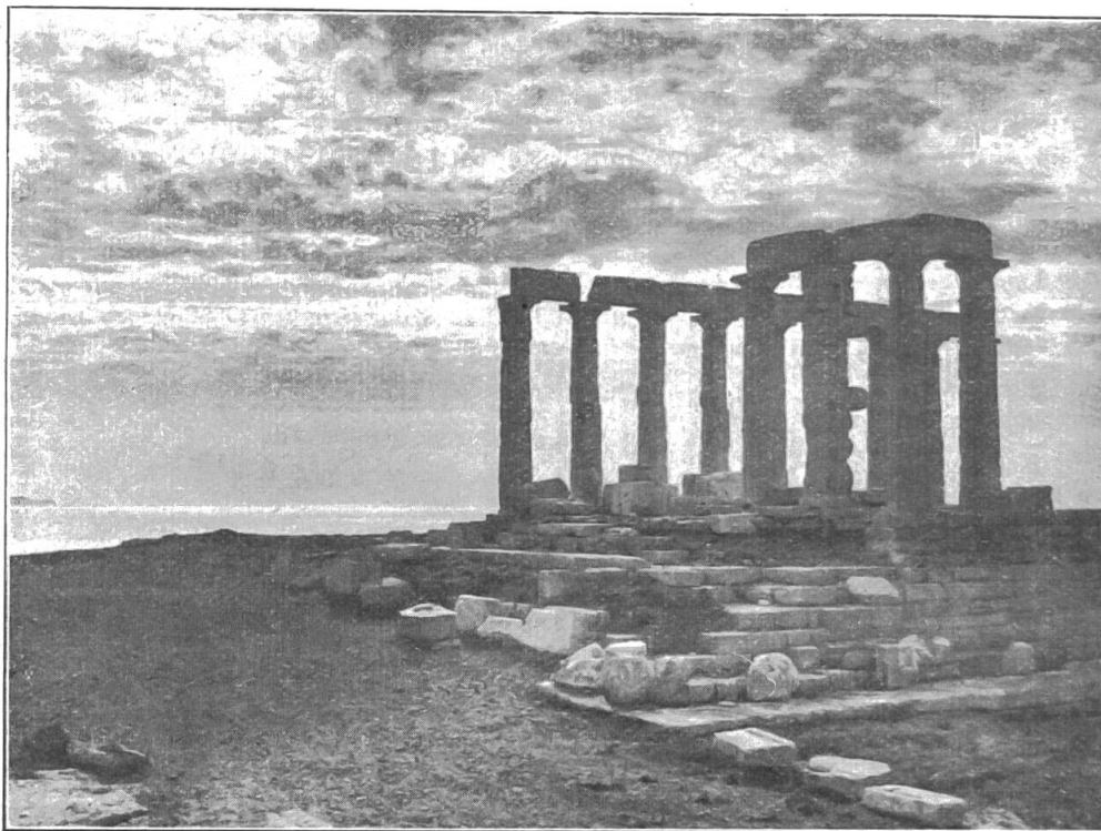
EN GRÈCE. — Le Temple de Poséidon, au Cap Sunium.