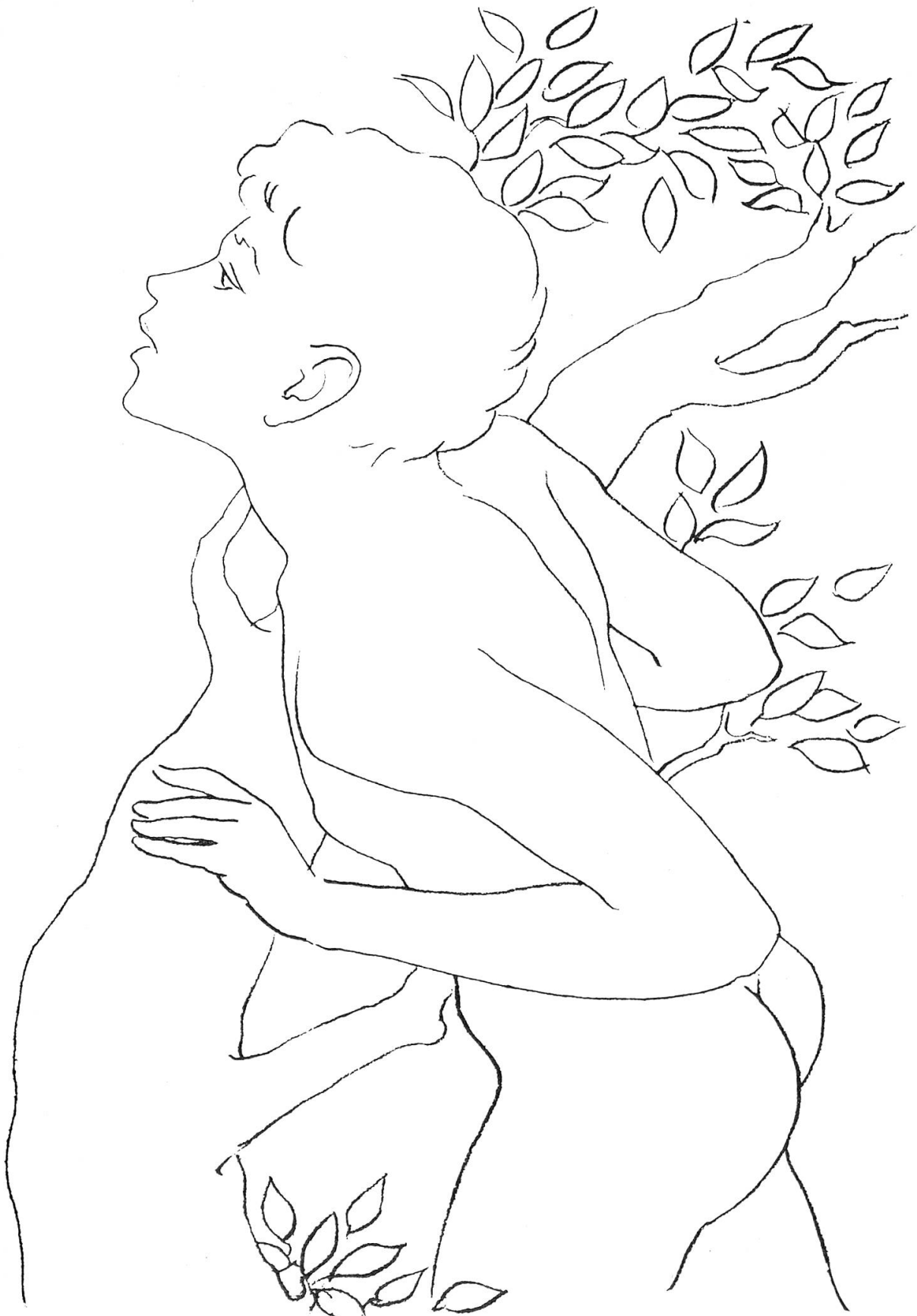
Zeichnung: Rico, Zürich