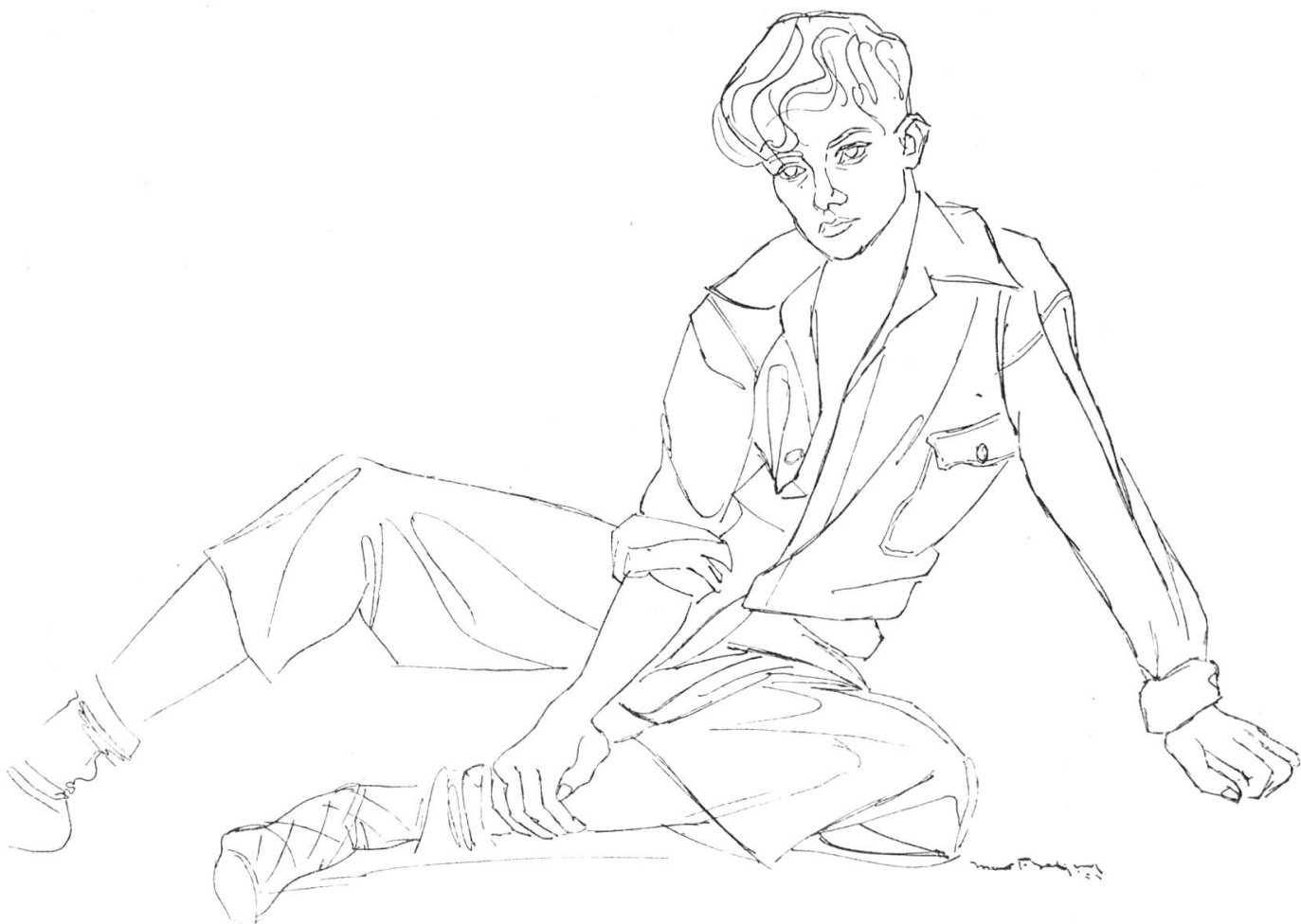
Zeichnung von Mario de Graaf, Amsterdam.