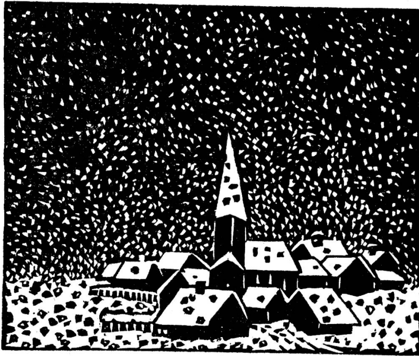
Holzschnitt von Frans Masareel