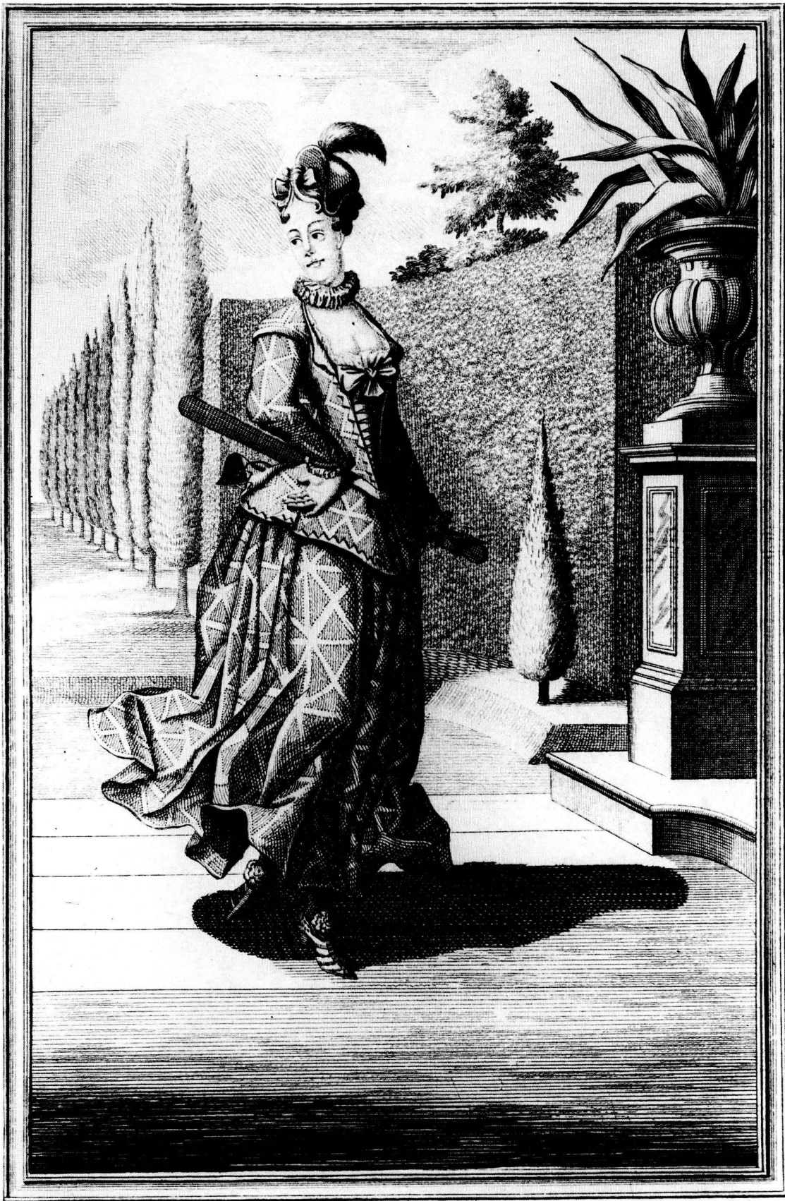
Tafel 5 HARLEQUINE