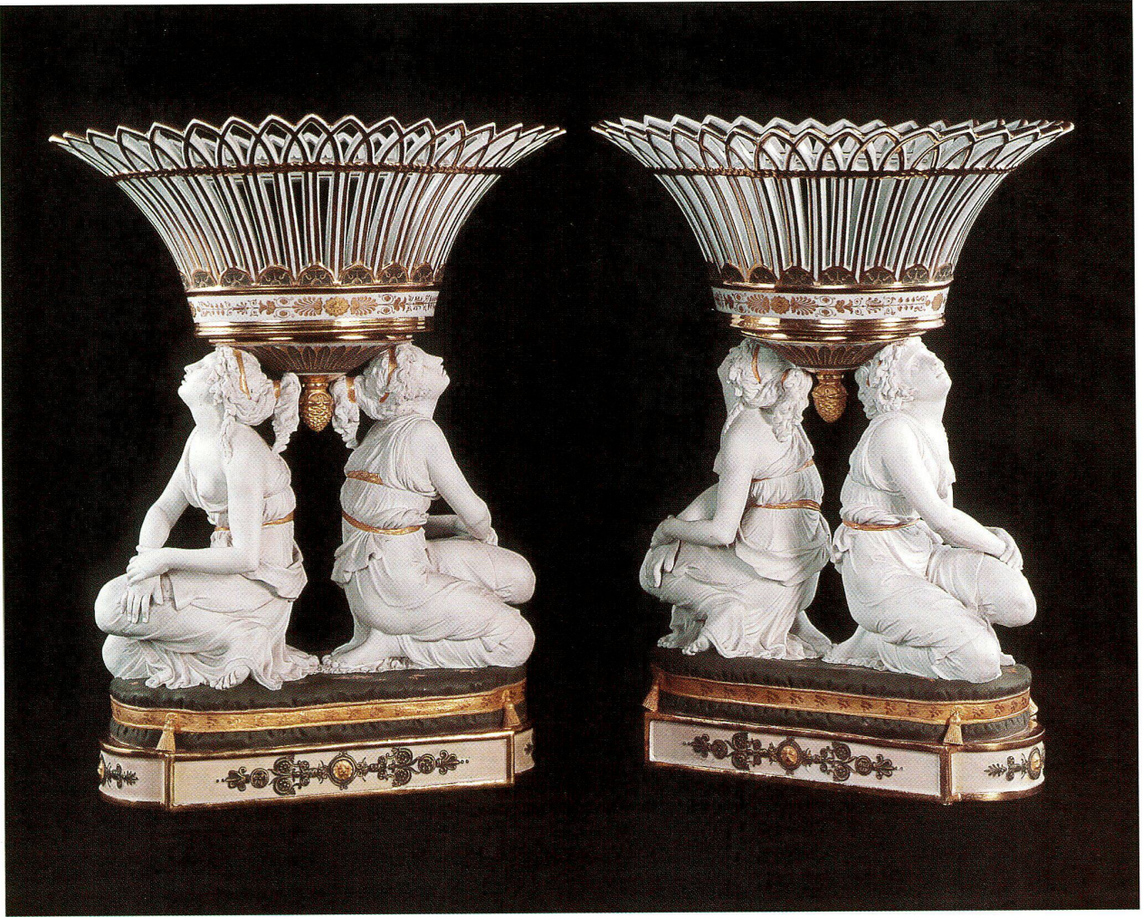
4 Zwei Körbe, getragen von je zwei antik gekleideten, knienden Frauen aus Biskuitporzellan. Modell von Charles-Christophe Windisch. Manufaktur Frédéric-Théodore Faber, Ixelles (Brüssel) 1824.