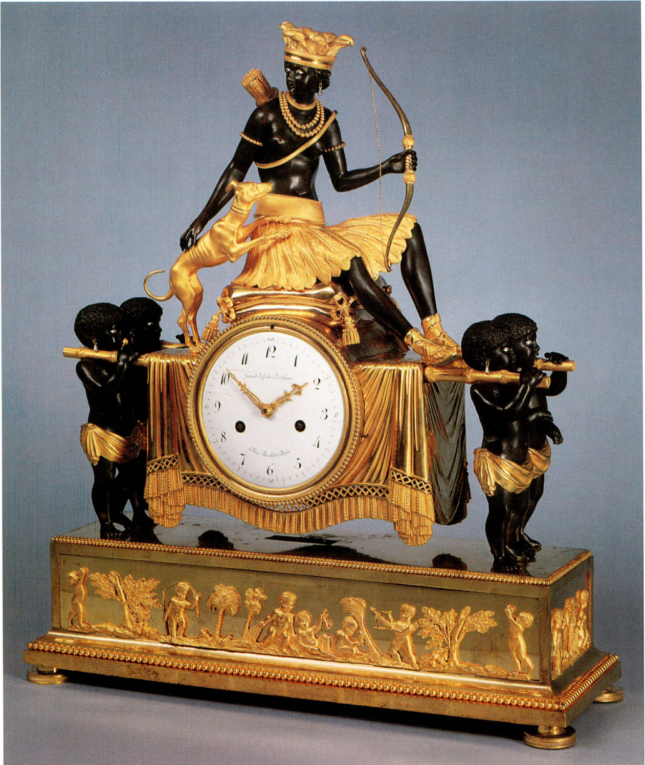
2 Pendule mit schwarzer, indianischer Jägerin auf von vier Negerlein getragener Bahre. Signiert: Invenit et fecit Deverberie rue Barbet à Paris . Um 1799.