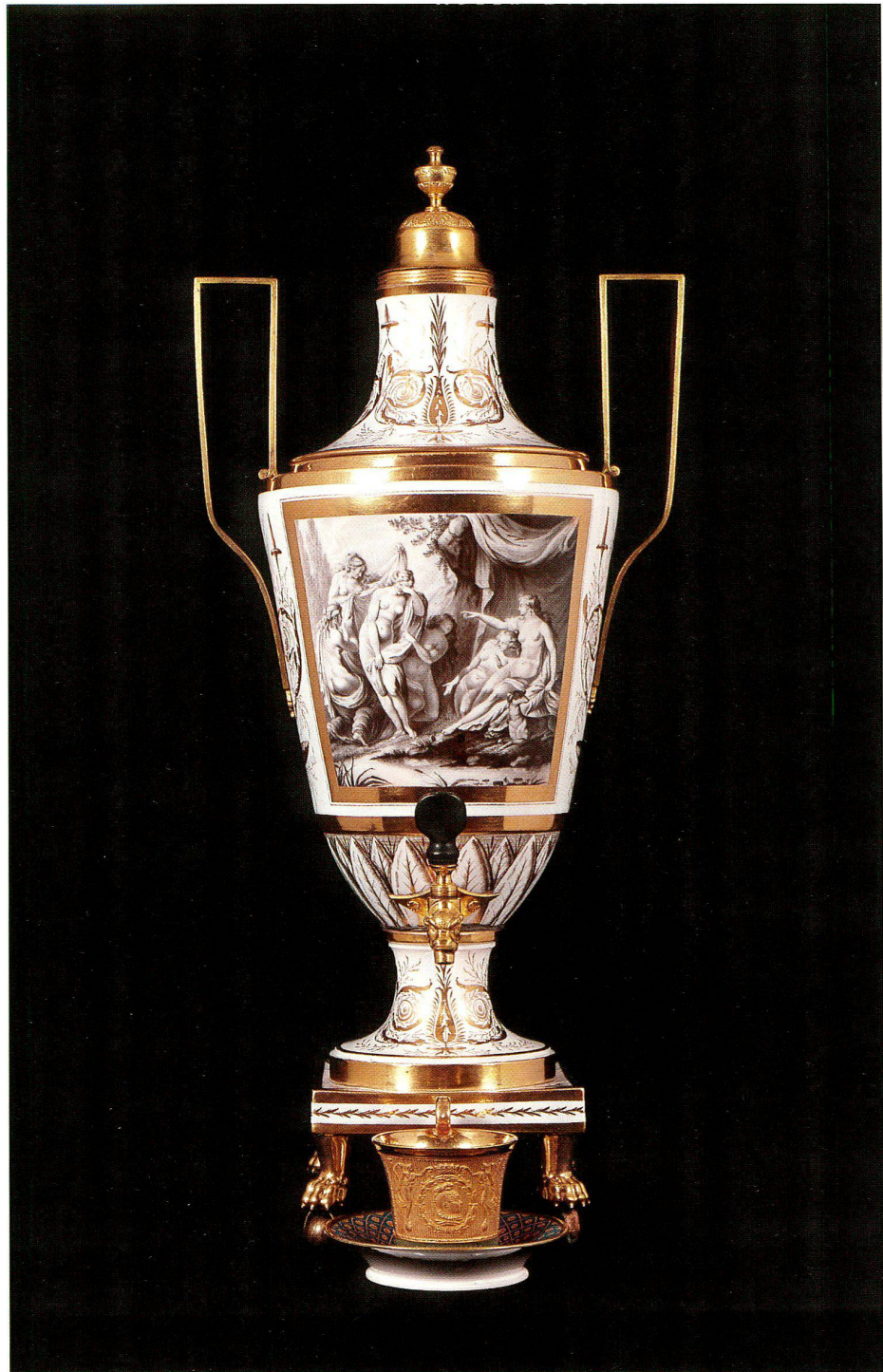
3 Samowar aus Porzellan, bemalt in Camaieu-Braun mit der Szene aus Ovids Metamorphosen, wie Diana die Schwangerschaft der Nympe Callisto entdeckt. Nach einem von Noël Lemire inspirierten Stich von Charles Eisen. H 69,5 cm. Paris, um 1795.